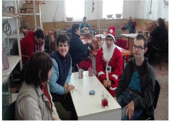
Vianočné posedenie s primátorom mesta