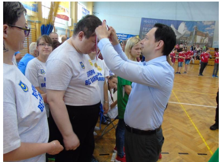
- Medzinárodná spartakiáda v Poľskom Tarnove