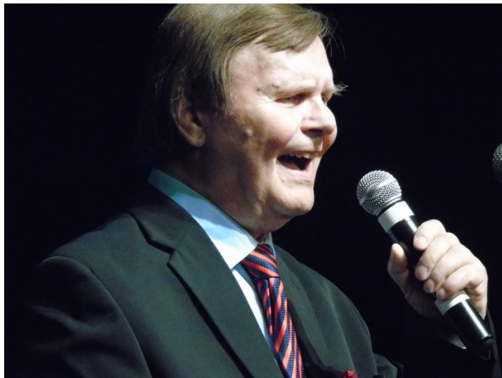
- benefičný koncert