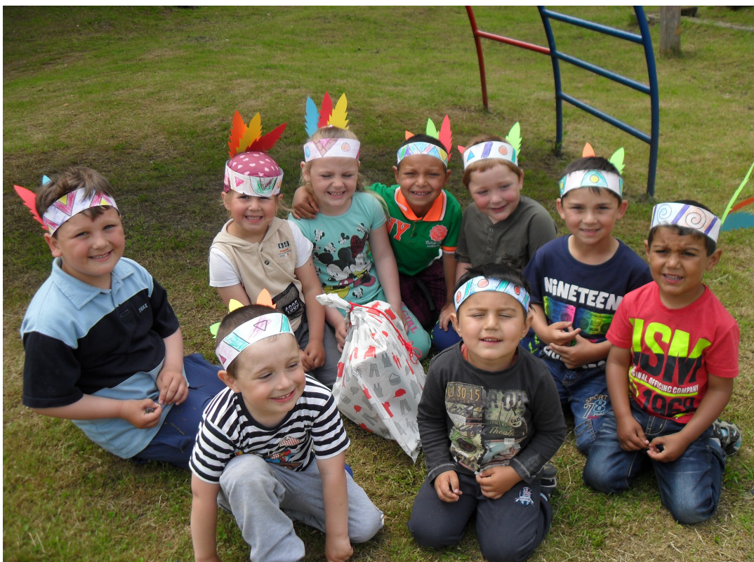
Deň detí v Materskej škole šk. rok 2014/2015