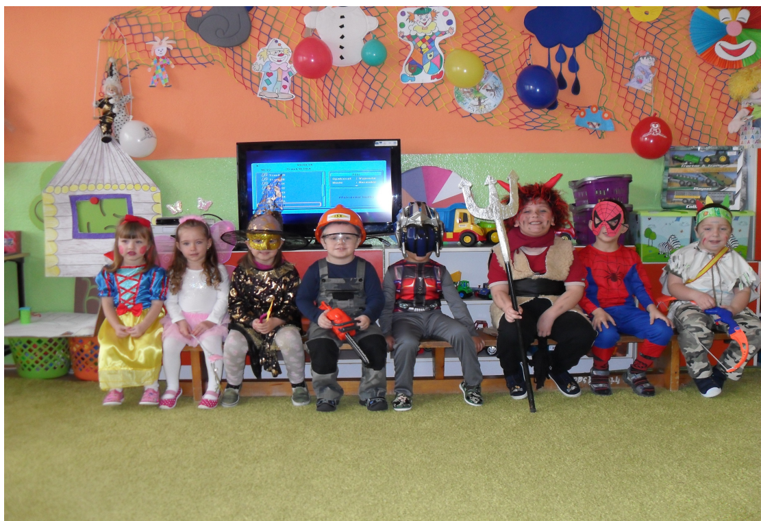
Maškarný ples v šk. roku 2015/2016