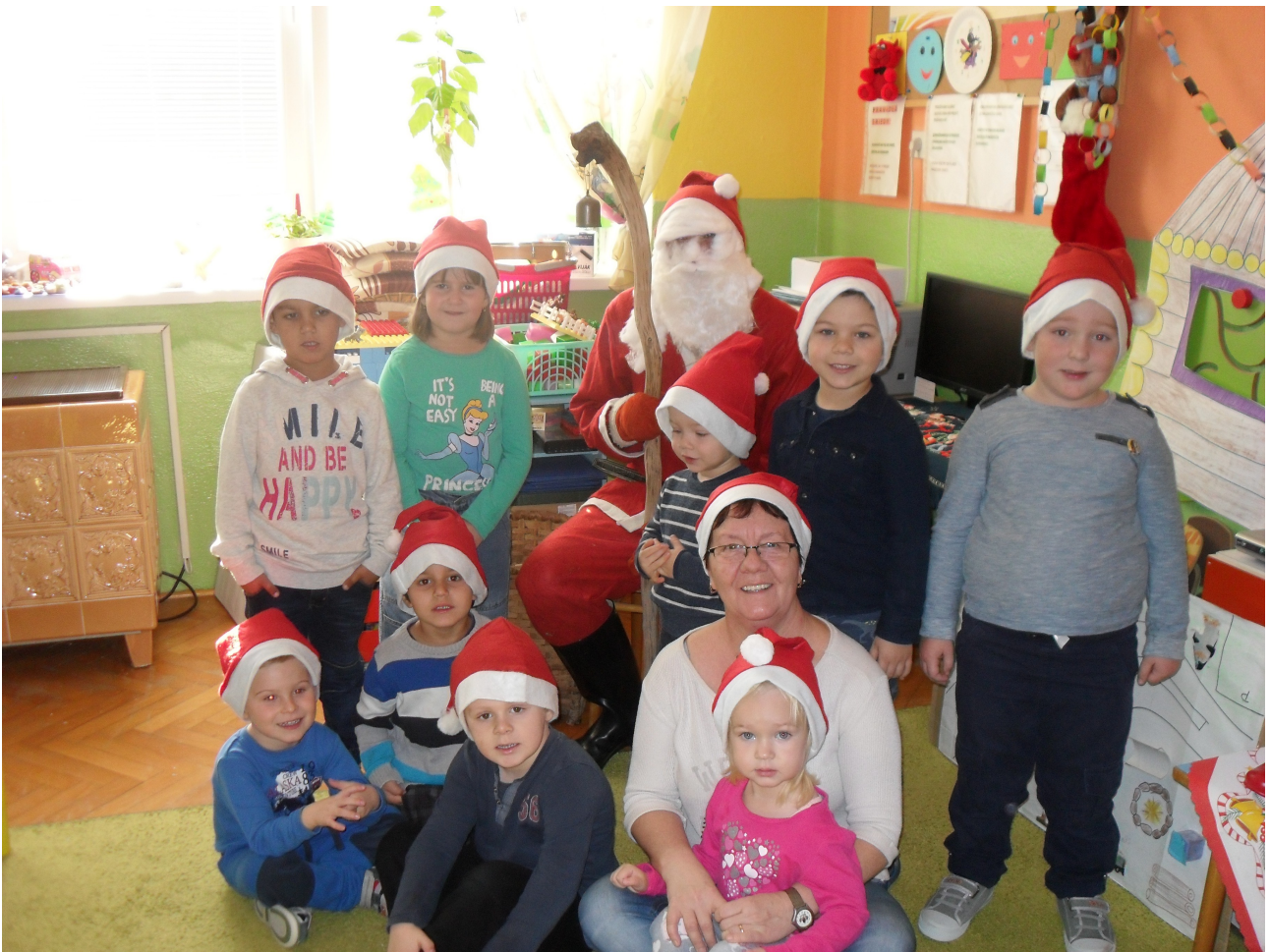
Mikuláš v Materskej škole v šk. roku 2016/2017