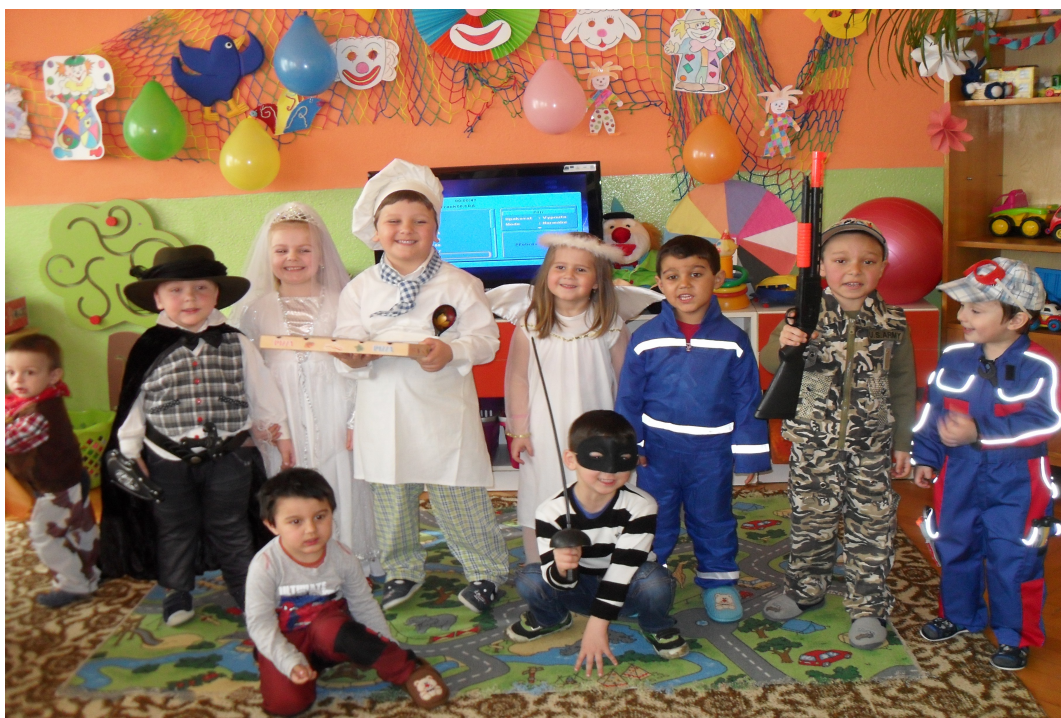
Maškarný ples v šk. roku 2014/2015