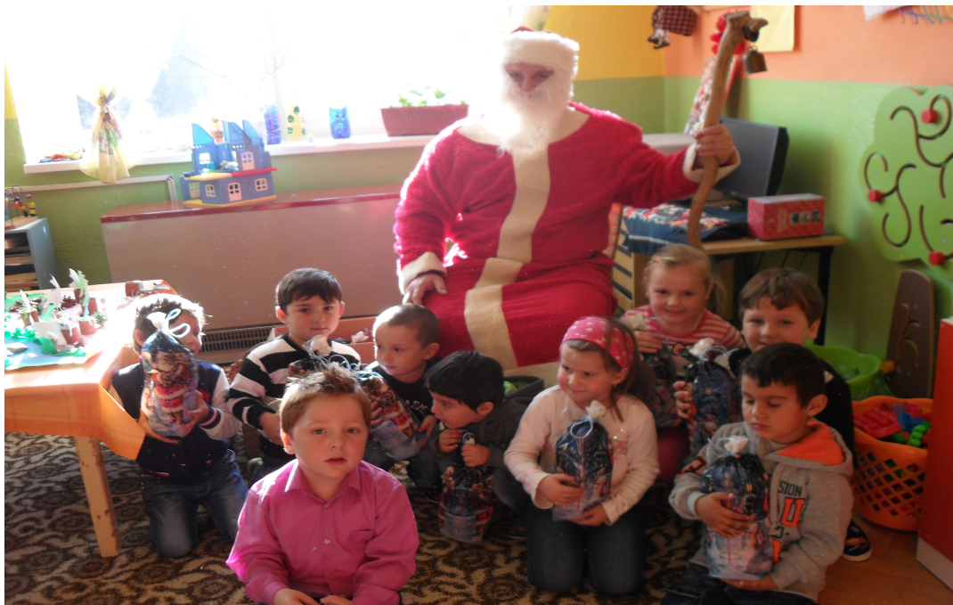
Mikuláš v Materskej škole v šk. roku 2015/2016