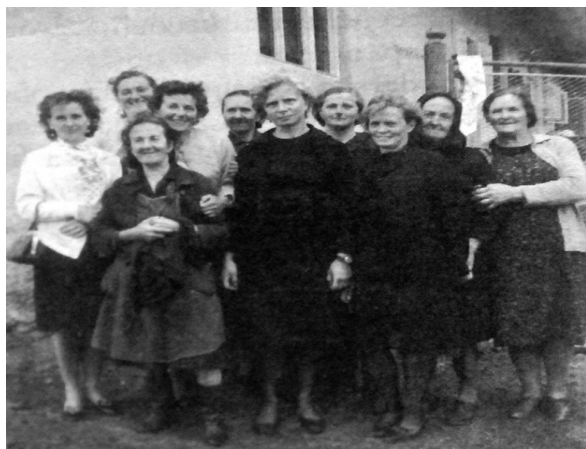
Táto fotografia vznikla pravdepodobne v 50 rokoch 20. storočia a vidíme na nej návštevu amerických migrantov v rodnej obci Kocel'ovce.