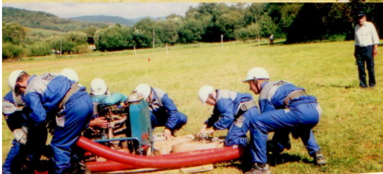
7.9.2006 sa v Kocelovciach konala hasičská

súťaž piaty ročník pretekov O putovný pohár Zaslúžilých členov Dobrovoľnej požiarnej ochrany v okrese Rožňava. Okresný výbor DPO SR v spolupráci s Obecným úradom v Kocelovciach a miestnym DHZ pripravili na dobre pripravenom priestranstve hasičské preteky, kde sa stretlo šestnásť družstiev v troch kategóriách, muži, dorastenky a dorastenci. Pretekali len v jednej disciplíne, v požiarom útoku s vodou. Súťažilo sa dvojkolovo, preteky boli zároveň jedinou možnosťou pre družstvá z okresu Rožňava, ako sa kvalifikovať na Gemerský pohár. Právo účasti si medzi dorastenkami okrem víťaziek zo Slavošoviec vybojovali vo veľmi kvalitnej súťaži aj dievčatá z Čiernej Lehoty a Koceloviec. V najlepšie obsadenej a určite aj najsledovanejšej kategórii mužov si právo účasti na Gemerskom pohári vybojovali družstvá DHZ z Koceloviec. Gemerský pohár sa uskutočnil 16.9.2006 v Kružnej, kde mal charakter euroregionálnych pretekov s medzinárodnou účasťou.