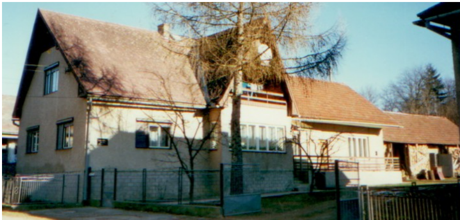
Budova novej fary