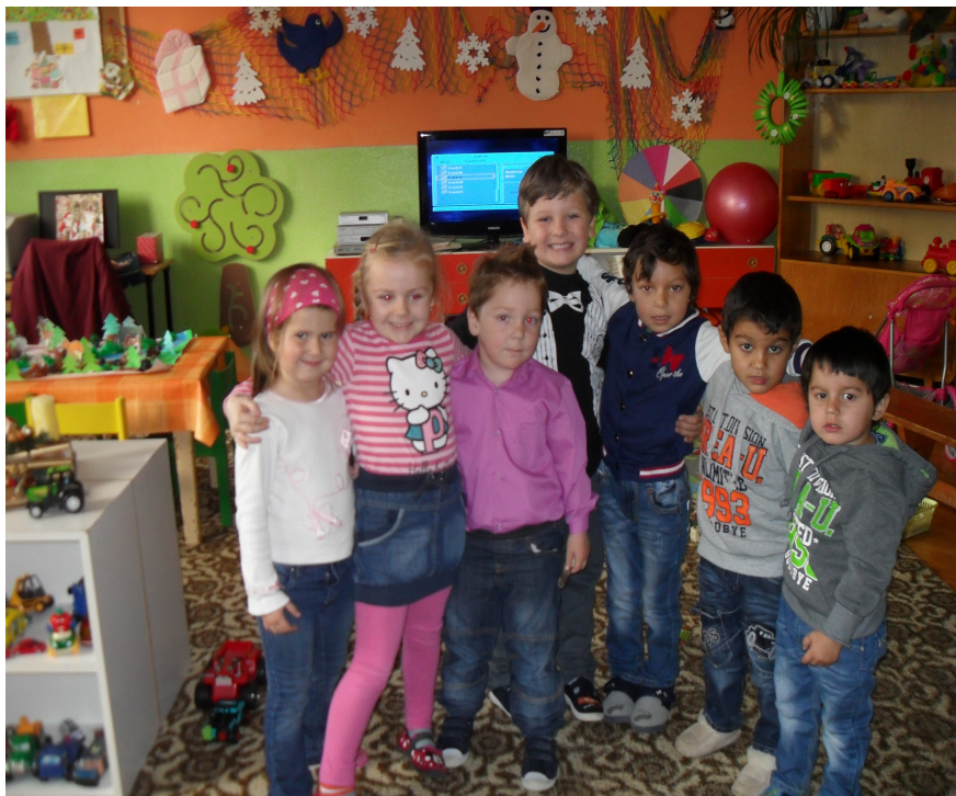
Mikuláš v Materskej škole v šk. roku 2015/2016