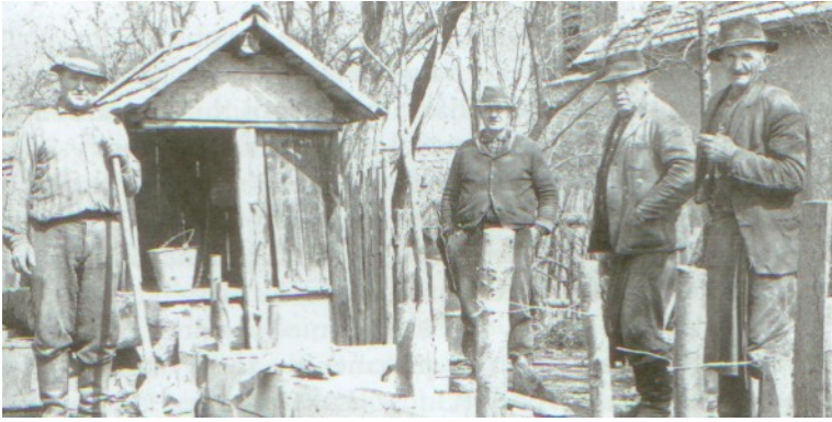
Muži z Kocel'oviec v pracovnom oblečení