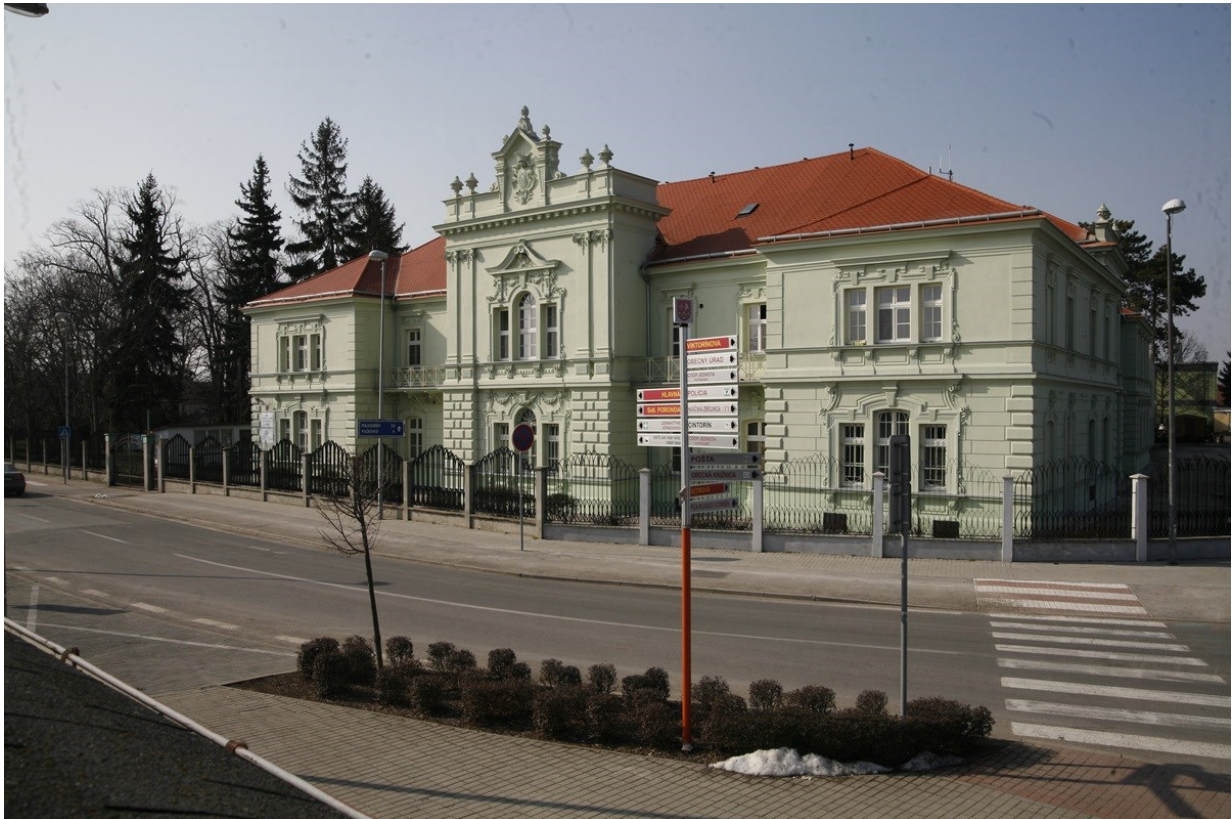
Kaštieľ rodiny Majláthovcov zo začiatku 19. storočia, dnes Domov sociálnych služieb pre duševne chorých v správe VÚC Trnava