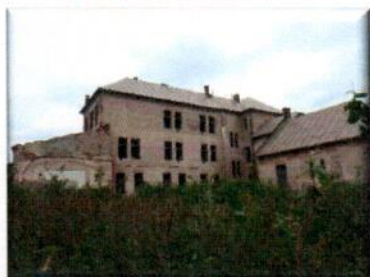
Bytový dom Jelšava II.