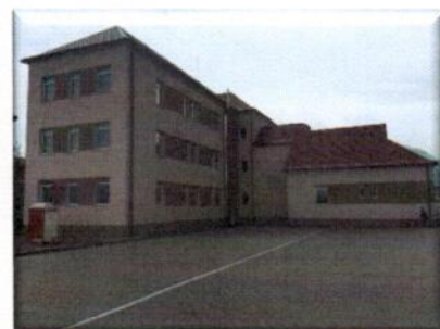
Prístavba, nadstavba a kompletná rekonštrukcia administratívnej budovy v Žiari nad Hronom