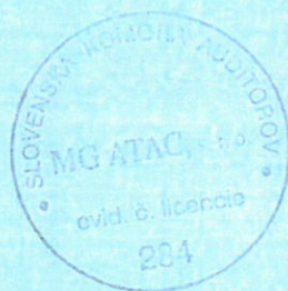
Kľúčový štatutárny audítor: Ing. Miroslav Galamboš Licencia SKAU č. 502

Audítorská spoločnosť: MG ATAC, spol. s r. o. Krškanská 21, Nitra Licencia SKAU č. 284