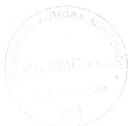
Kľúčový štatutárny audítor: Ing. Miroslav Galamboš Licencia SKAU č. 502

Auditorská spoločnosť: MG ATAC, spol. s r. o. Krškanská 21, Nitra Licencia SKAU č. 284