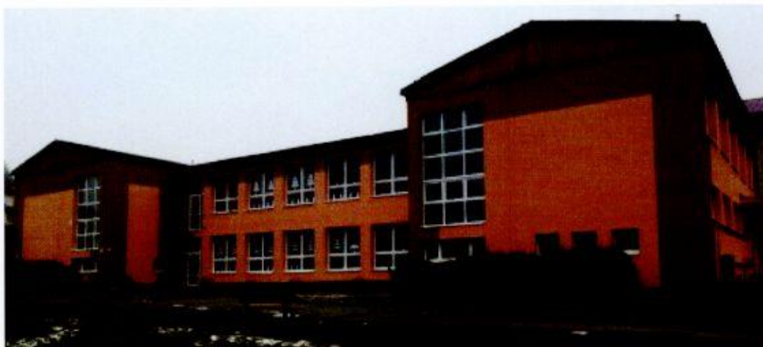
Základná škola s Materskou školou

Najstaršou budovou, okrem kostolov a kaplniek, je v Banskej Belej budova školy, nad krytým schodišťom, vedúcim ku kostolu. Na tejto budove je zachovaný plastický kamenný banický erb s letopočtom 1564. Budova, pôvodne renesančná, s neskoršími stavebnými úpravami, má v prízemí zo schodišťa vchod do pôvodnej školskej triedy, v ktorej sa zachovala ešte pôvodná renesančná hrebienková klenba. V hornom podlaží bol byt pre učiteľa a organistu. Budova slúžila pre školské účely do roku 1868. Okrem historických objektov sa v obci nachádzajú aj dve novodobé školské budovy, konkrétne budova materskej škôlky a základnej školy, nachádzajúcej sa neďaleko farského kostola a cintorína.