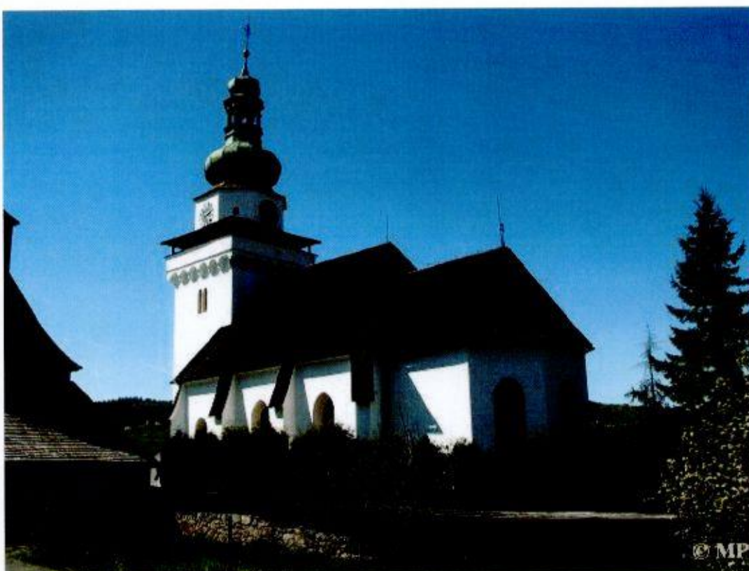
Rímskokatolícky farský kostol sv. Jána apoštola a evanjelistu.

Najvýznamnejšou dominantou a bezpochyby aj najstaršou budovou obce je rímskokatolícky farský kostol sv. Jána apoštola a evanjelistu. Bol vybudovaný v polovici 13. storočia v neskororománskom slohu a orientovaný je v smere východ - západ, so svätyňou na východ. Podľa najnovšieho schematizmu bol vysvätený pravdepodobne v roku 1243.