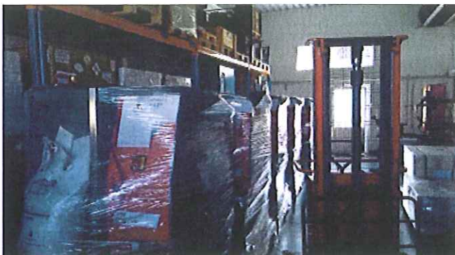
Skladové priestory spoločnosti