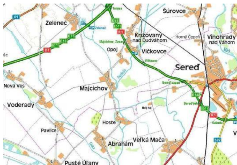
Obr. č. 1. Poloha obce v regióne