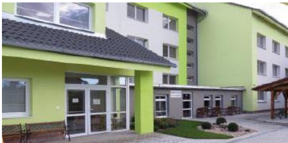
Budova Zariadenia pre seniorov Križovany nad Dudváhom

stravovacou prevádzkou. Pripravujú sa chody jedál ako raňajky, desiata, obed, olovrant a večera. Zdravotná starostlivosť je zabezpečovaná ošetrojúcou obvodnou lekárkou priamo v zariadení. Lekárka pravidelne navštevuje obyvateľov zariadenia, podľa potreby aj na ich izbách. Odborné vyšetrenia klientov sa vykonávajú priamo u odborných lekárov, na základe odporúčenia ošetrojúceho lekára.