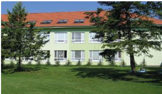
Budova Základnej školy s materskou školou Križovany nad Dudváhom