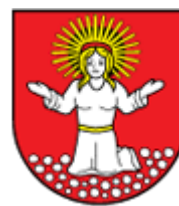
Obec STRATENÁ www.stratena.net