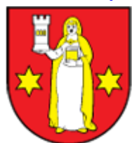
Obec HRANOVNICA www.hranovnica.sk