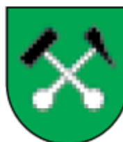
Obec HNILEC www.hnilec.eu