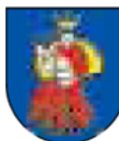
Obec LETANOVCE www.letanovce.eu