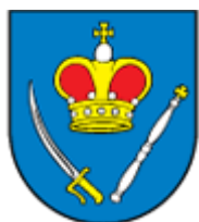
Obec DEDINKY www.dedinky.eu