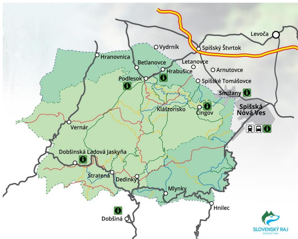
Mapa 1: Geografická poloha združenia

Združenie Mikroregión Slovenský raj tvorí 11 obcí a mesto Spišská Nová Ves, 6 podnikateľských subjektov a 2 združenia podnikateľov v cestovnom ruchu. Členmi sú aj Správa Národného parku Slovenský raj a Horská záchranná služba Slovenský raj. Mikroregión vznikol v roku 2003. Zakladateľmi boli obce Hrabušice, Spišské Tomášovce a Letanovce. Postupne sa pridávali ďalšie obce, mesto, inštitúcie a podnikatelia. Územie Mikroregiónu reprezentujú obce, ktoré sa nachádzajú na hranici Slovenského raja zo severu aj z juhu. Členovia prezentujú nielen krásnu prírodu národného parku, ale aj historické a kultúrne pamiatky v lokalite.