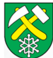
Obec MLYNKY www.mlynky.sk