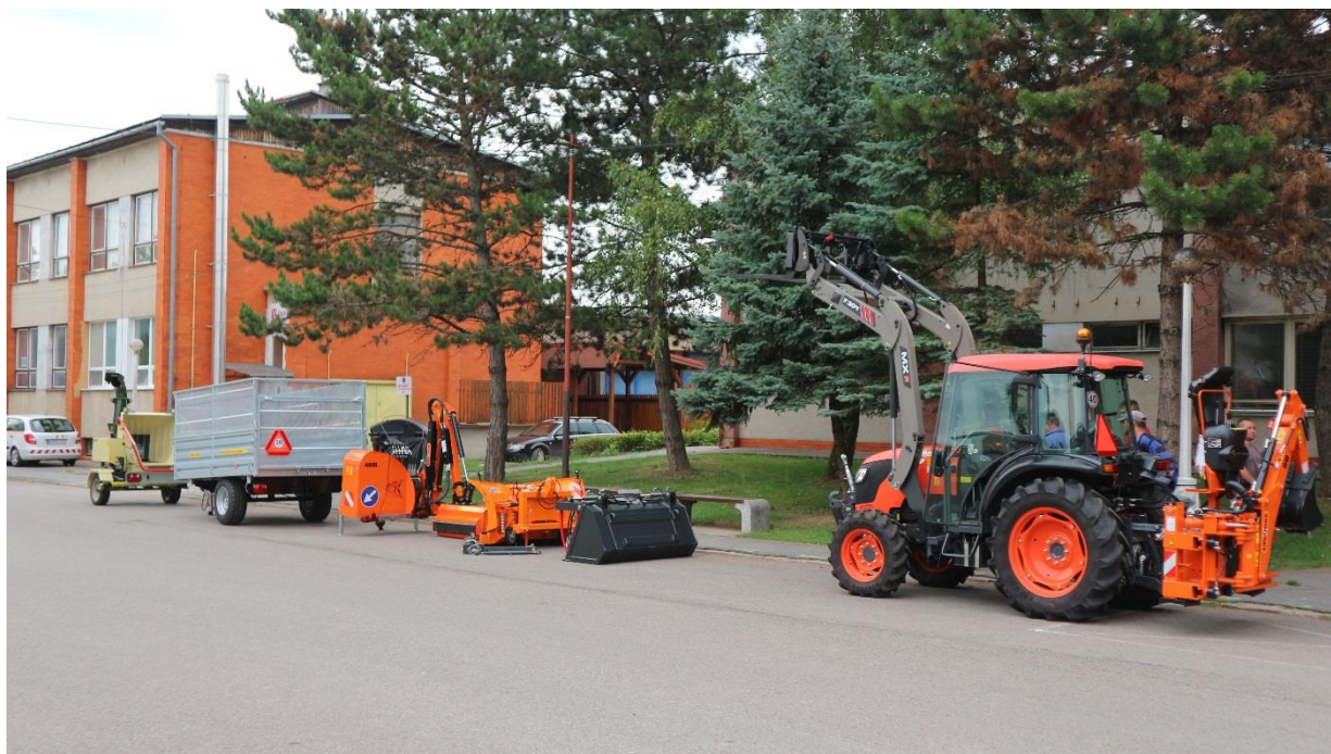
Zakúpený traktor a príslušné zariadenia z transferu.

Obec Beluša na základe zmluvy č. OPKZP-PO1SC111-2016-11/13 uzatvorenej medzi Ministerstvom životného prostredia Slovenskej republiky a Obcou Beluša prijala transfer na financovanie projektu „podpora zhodnocovania biologicky rozložiteľného komunálneho odpadu v obci Beluša“ v sume 103 759,00 Eur. Finančná spoluúčasť obce na tomto projekte bola 5 %.