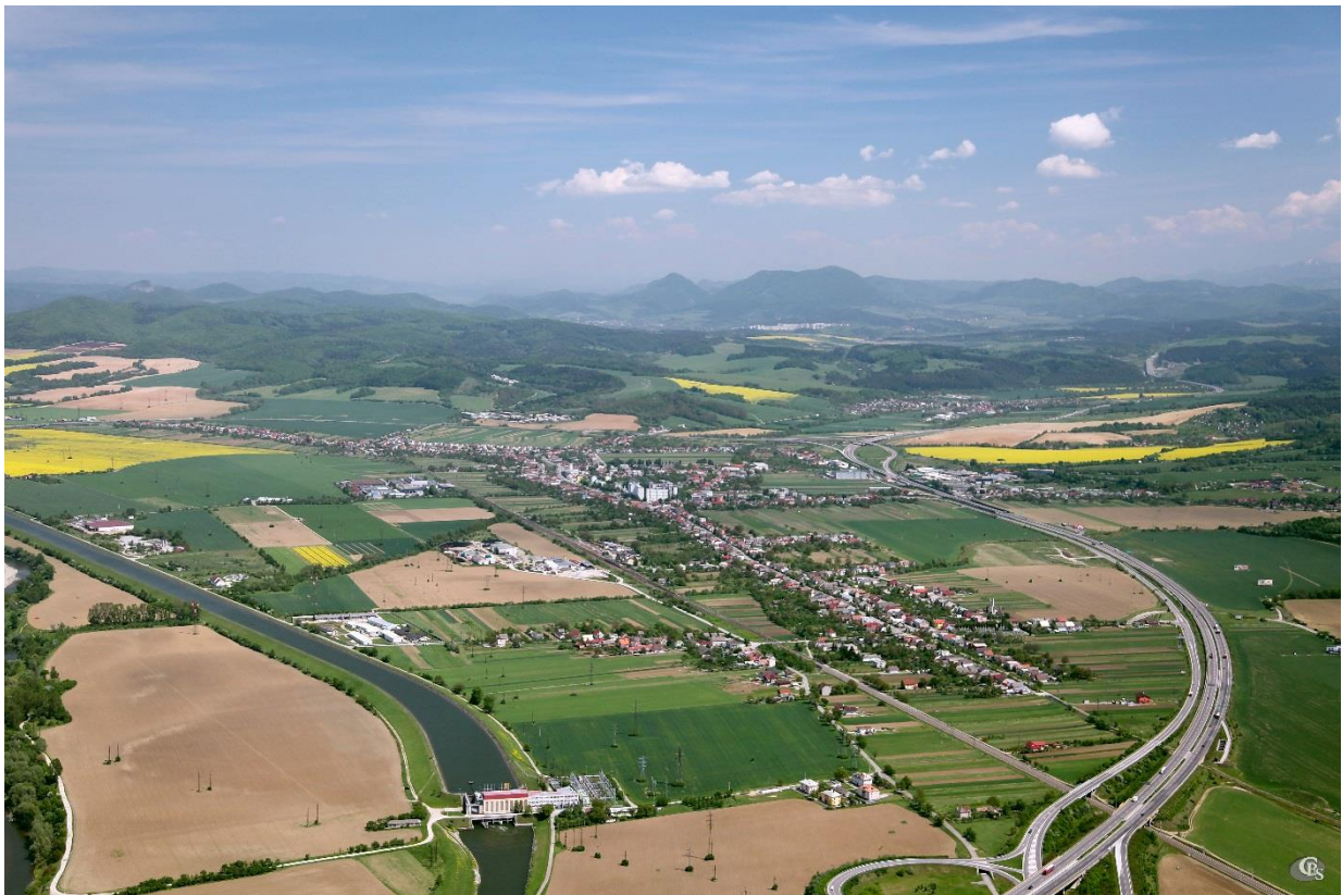
Pohľad na Belušu

Nadmorská výška: 256 m n.m (v strede obce)