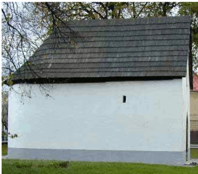
Kostolík sv. Anny s gotickým portálom priečelia

Kostolík pochádza z druhej polovice 13. storočia, stavebne bol upravený okolo roku 1300.