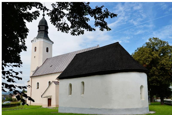
Farský kostol sv. Alžbety Uhorskej.