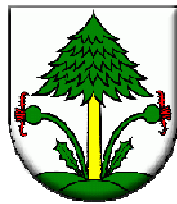
Obr. 1 – Erb obce Beňadovo

Erb obce: V striebornom štíte z troch nízkych zelených kopčekov vyrastá zelený smrek so zlatým kmeňom, po bokoch ktorého vyrastá po jednej zelenej rastline Benediktu lekárskeho s červeným kvetom.