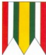
Obr. 2 – Vlajka obce Beňadovo

Vlajka obce: Vlajka pozostáva zo siedmich pozdĺžnych pruhov vo farbách červenej (1/8), bielej (1/8), zelenej (1/8), žltej (2/8), zelenej (1/8), bielej (1/8) a červenej (1/8). Vlajka má pomer strán 2:3 a ukončená je tromi cípmi, t. j. dvomi zostrihmi, siahajúcimi do tretiny listu vlajky.