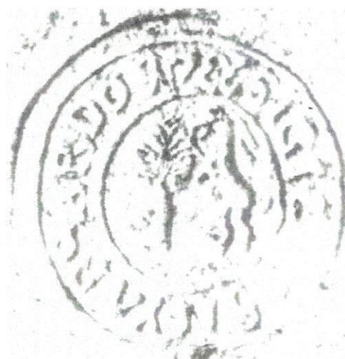
Pečať z roku 1786