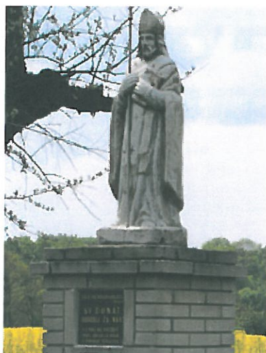
Socha svätého Donáta