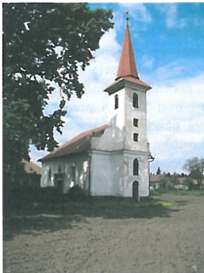
Kostol reformovanej kresťanskej cirkvi

Počiatky stavebného vývoja kostola Reformovanej kresťanskej cirkvi, ľudovo nazývanej kalvínskej, siahajú do roku 1790. Počas svojej existencie bol prestavaný, predovšetkým však v roku 1876, kedy bola ku kostolu pristavaná veža. Exteriér kostola je členený lizénovým rámovaním.