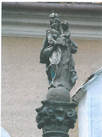
Mariánsky barokový stĺp