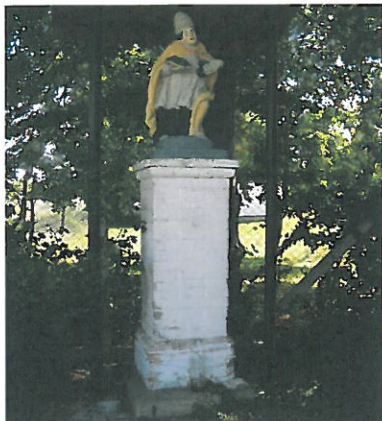
Socha svätého Urbana

Socha sa nachádza pri rieke Nitra, v blízkosti mosta.