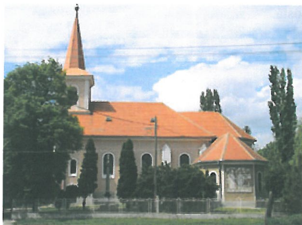
Rímskokatolícky kostol z r.1892