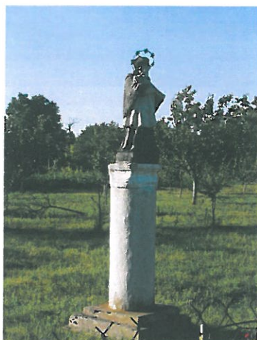
Socha svätého Jána Nepomuckého