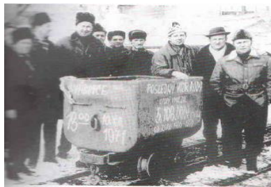
Posledný vagón s rudou vyvezený z bane