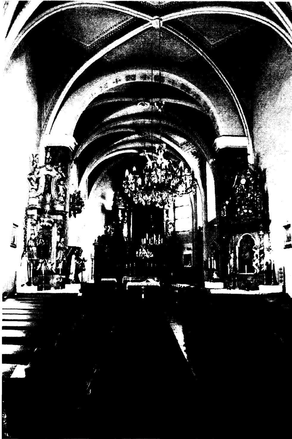
Interiér kláštorného kostola Nájdenia sv. Kríža.