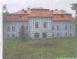
Stav v roku 2002

Dátum vzniku tohto kaštieľa nie je presne známy, z hľadiska stavebného vývoja a slohového zaradenia sa jedná o budovu, ktorá vznikla zo staršej renesančnej stavby, datovanej do 17. storočia, prestavanej a prefasádovanej v 2. polovici 18. storočia do dnešnej barokovo-klasicistickej podoby.