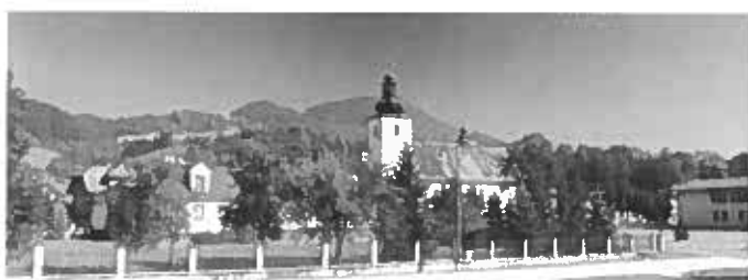
Kostol sv. Ladislava,