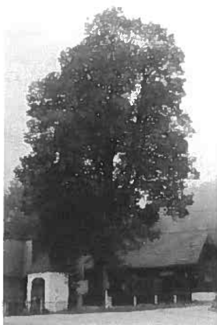
chránený strom – lipa veľkolistá,