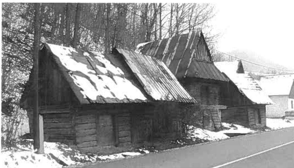
zrubové sýpky – sypárne.