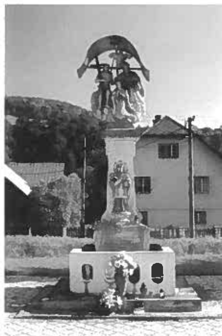
Kamenný stĺp so súsoším Korunovania Panny Márie,