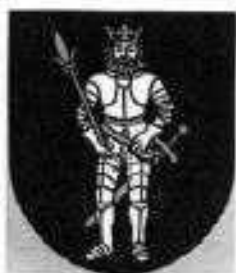
Erb obce :