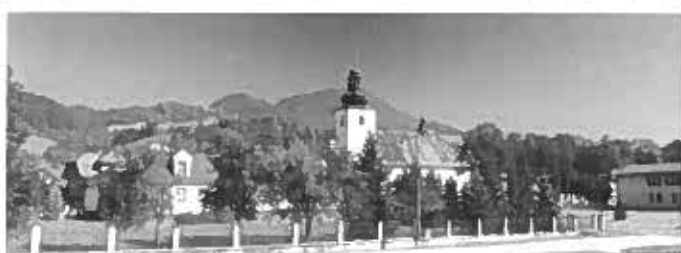
Kostol sv. Ladislava,