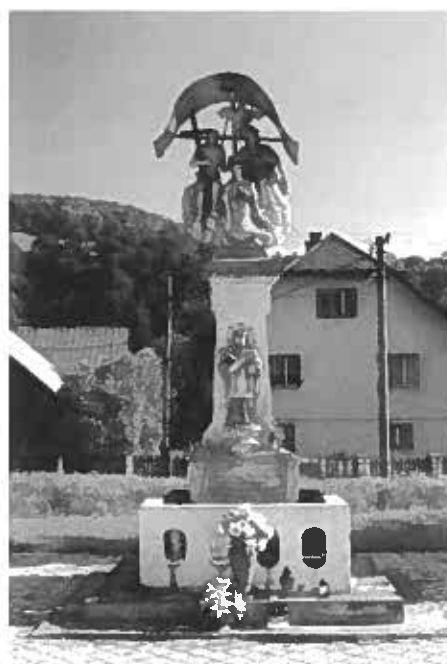
Kamenný stĺp so súsoším Korunovania Panny Márie,