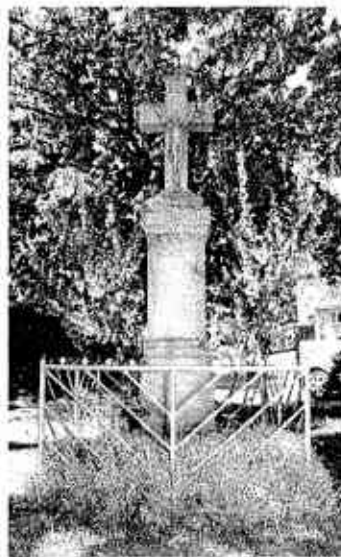
Kristus na kríži