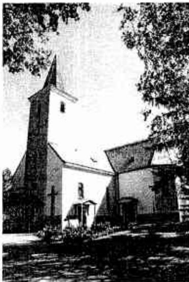
Rímskokatolícky kostol svätej Anny