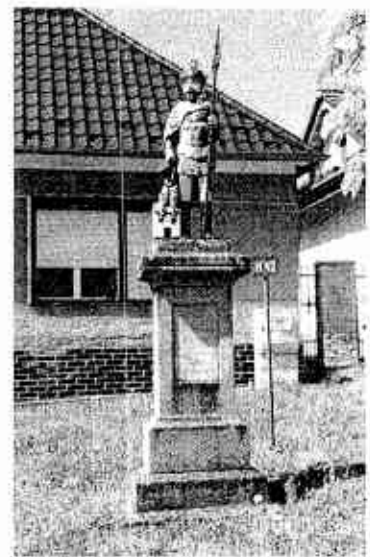
Socha svätého Floriána