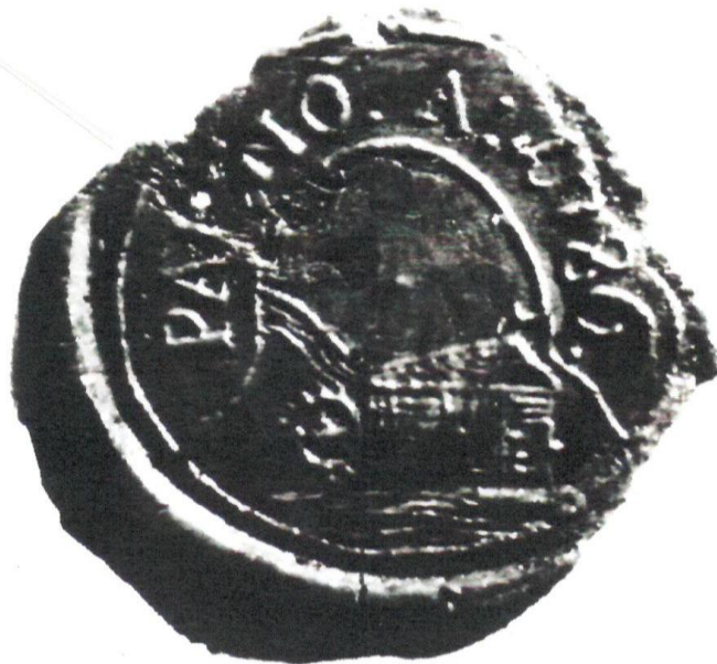
Pečať z roku 1786