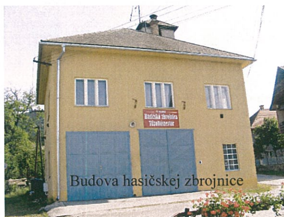
Budova hasičskej zbrojnice

V obci pôsobí Dobrovoľný hasičský zbor , ktorý vznikol v r. 1929. Súčasná hasičská zbrojnica bola stavaná v rokoch 1956-1960 v akcii Z. Zbor má v súčasnosti 40 členov.