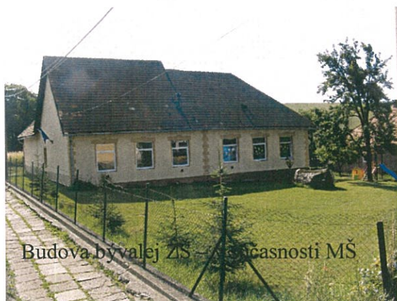
Budova bývalej ZŠ – súčasnosti MŠ