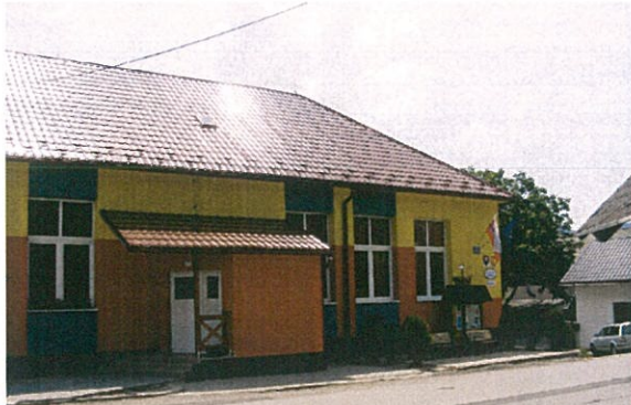
Prestavba budovy kultúrneho domu a obecného úradu na obecný inkubátor bola vykonaná v r.2010 a r.2011