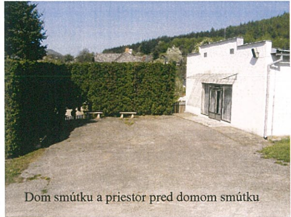
Dom smútku a priestor pred domom smútku