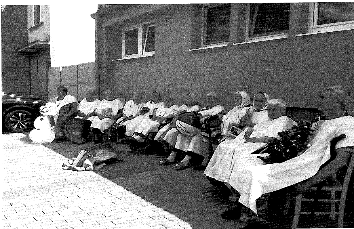
Rozprávkový pochod dedinou 2018- Rozprávka o dvanástich mesiačikoch