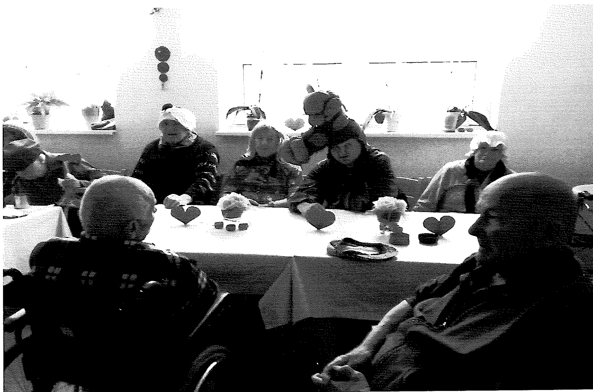
Fašiangový maškarný ples 2018