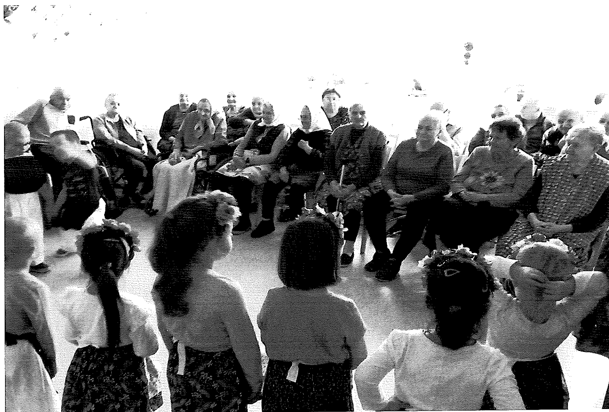
Vystúpenie detí MŠ Unín