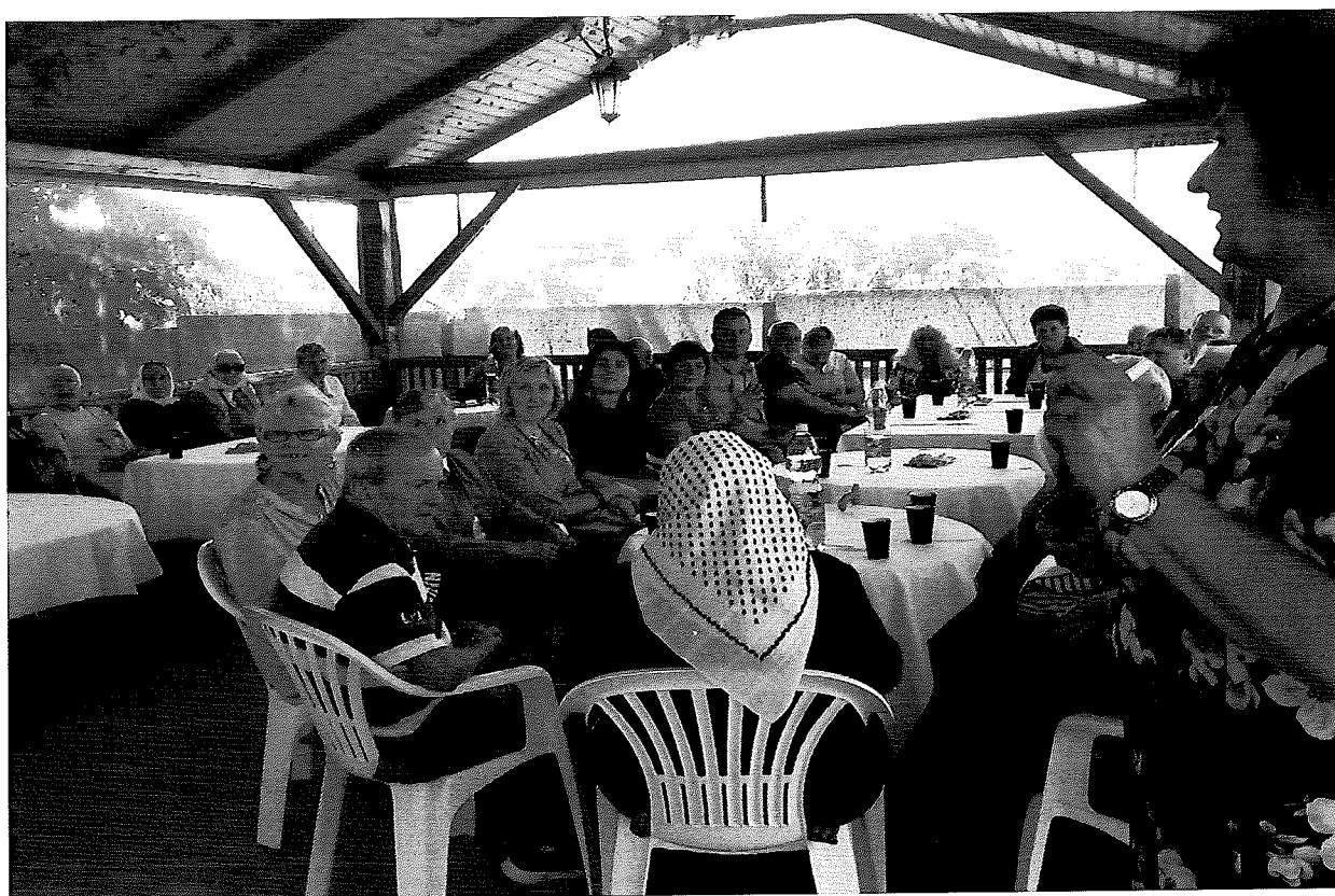
Cesta históriou 2018