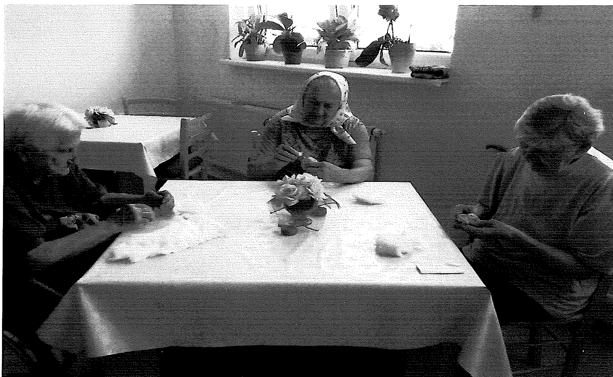
Terapie klientov- ručné práce