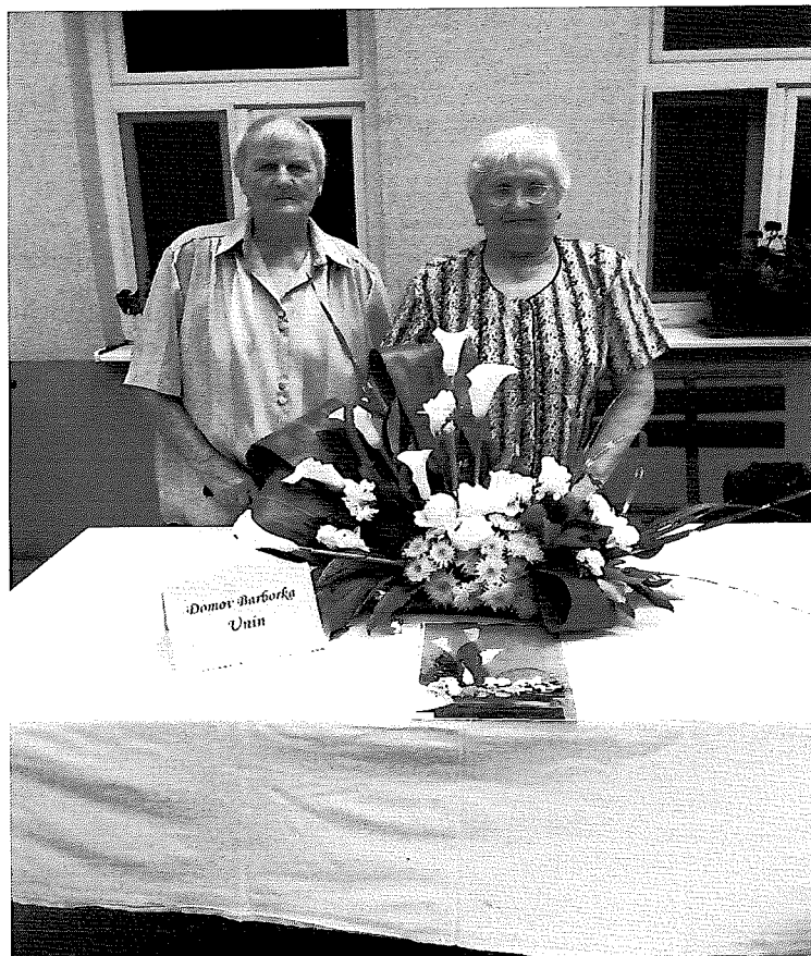
Na kvetinovom dni v Holíči 2018