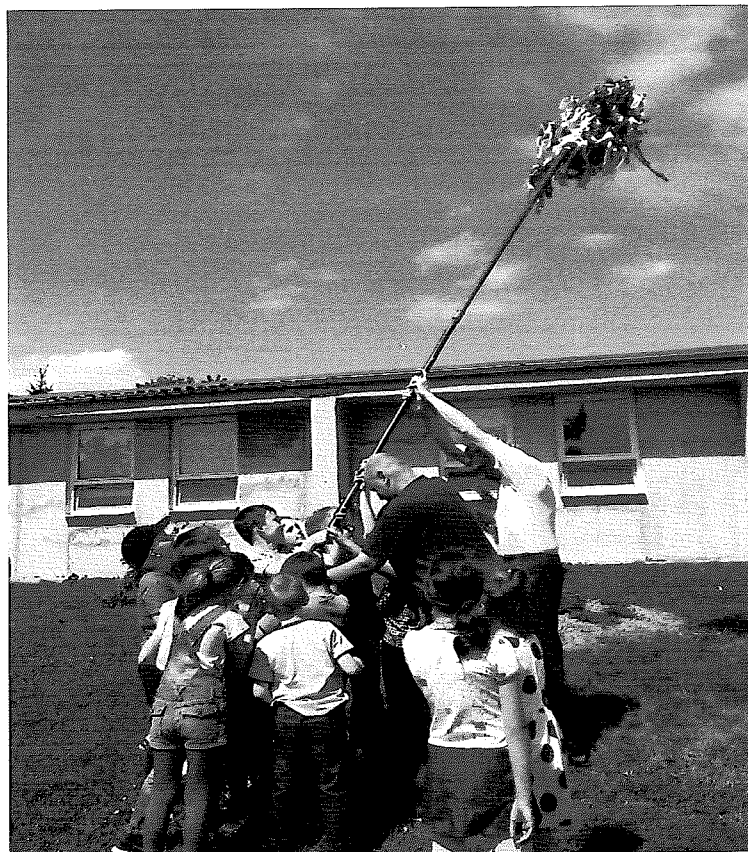
Stavanie mája s pomocou detí školského klubu ZŠ Unín