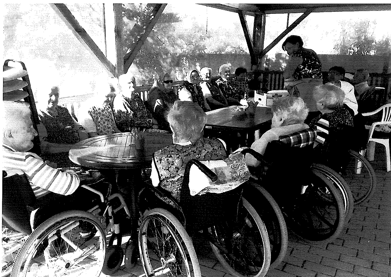
Posedenie pod altánkom pri príležitosti osláv jubilatov