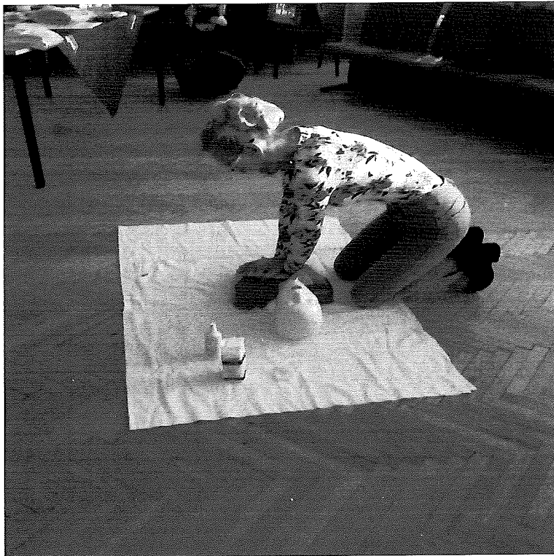
Školenie prvej pomoci zamestnancov v Kútoch