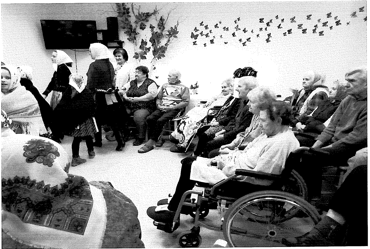
Vystúpenie detí a ich rodičov „Valše“ z Holiča