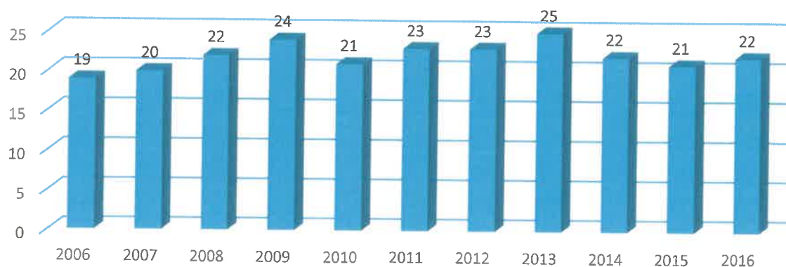
Priemerný počet zamestnancov v spoločnosti v rokoch 2006 - 2016

Spoločnosť DYNAMIK TRADING, s.r.o. k 31.12.2016 zamestnávala 25 ľudí v hlavnom pracovnom pomere.