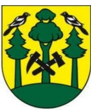
Erb obce Turček

Obec má právo na vlastné symboly. Obec, ktorá má vlastné symboly, je povinná ich používať pri výkone samosprávy. Symboly obce sú erb obce, vlajka obce, pečať obce. (zákon č. 369/1990 Zb. o obecnom zriadení)