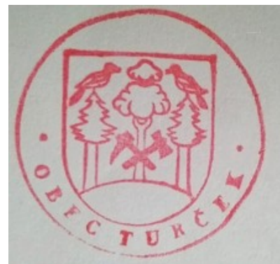
Pečať obce Turček