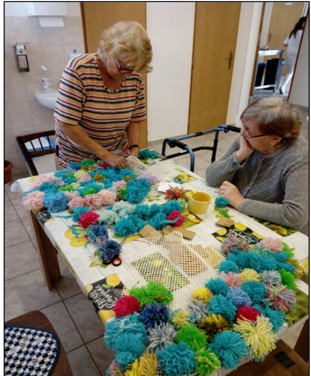
Výroba senzorického koberca