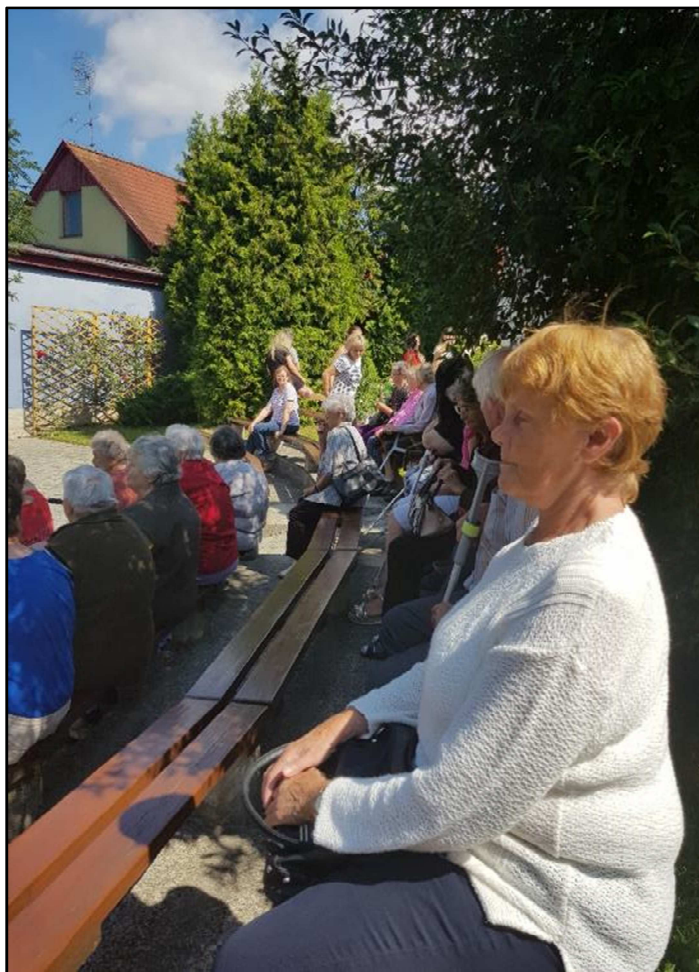
Divadelné predstavenie v meste Topoľčany

Pre ležiacich klientov, resp. klientov, ktorým ochorenie bráni niečo manuálne vykonávať sme zaviedli čítanie z kníh, kedy najmä v lete ocenili možnosť byť na čerstvom vzduchu a počúvať popri tom nejaký príbeh. Do tejto aktivity sme zapojili aj klientov, ktorých úlohou bolo najskôr vylúštiť doplnovačku (príbeh, v ktorom chýbali písmená a klienti ich museli podopíňať, čím si precvičili aj písanie a kognitívne funkcie) a potom nahlas čítali príbeh, pričom každý klient mal iný príbeh. Daná aktivita prispieva k utužovaniu vzťahov medzi klientmi navzájom. V tejto súvislosti si klienti sami vyrobili aj spoločenské hry – pexeso, človeče nehnevaj sa, dámu. V rámci rozšírenia aktivít plánujeme v roku 2019 zaviesť hranie spoločenských hier, najmä Bingo.