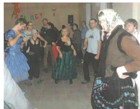
Obrázok 5 Fašiangová zábava

Oblasť športu v našej obci reprezentovala Telovýchovná jednota TJ Čabrad-Dolný Badín založená v