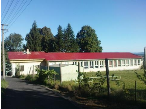
Obrázok 4 Budova ZŠ Dolný Badín