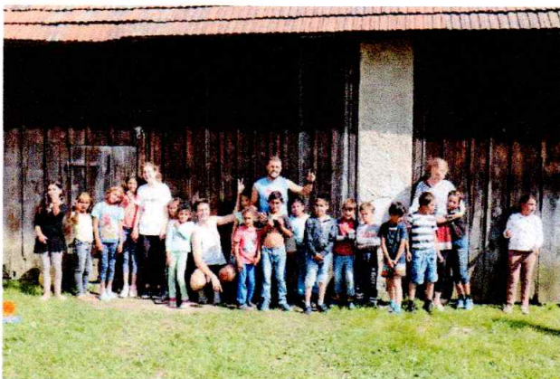
CBF Heartland Arcansas - Máj 2018