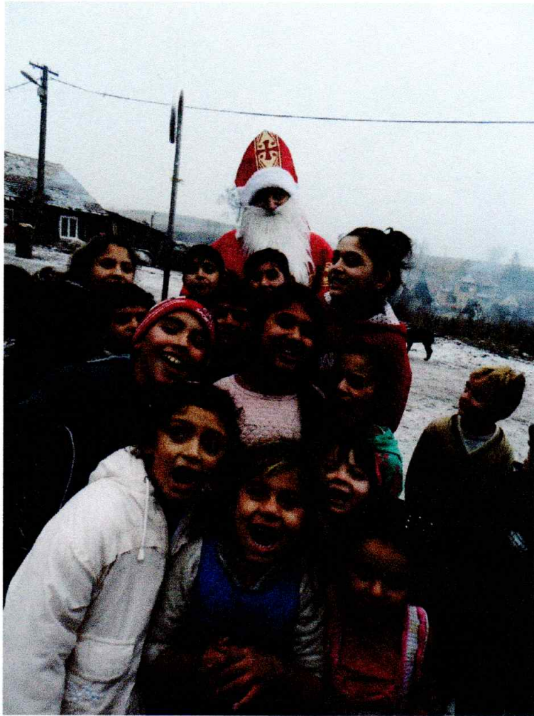
Mikuláš v osade Dolinka