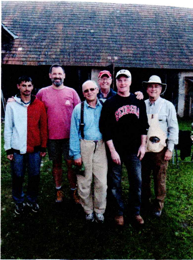
CBF Athens - september 2018