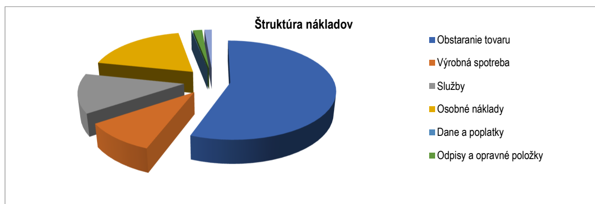
Graf č. 3

Náklady Spoločnosti dosiahli v roku 2018 sumu 361.317,- €, čo v priemere na mesiac predstavuje sumu 30.109,75 €, čo v porovnaní s minulým rokom predstavuje pokles priemerne mesačne o 4.561,17 € . Podiel jednotlivých druhov nákladov na celkových nákladoch spoločnosti zobrazuje graf č. 3.