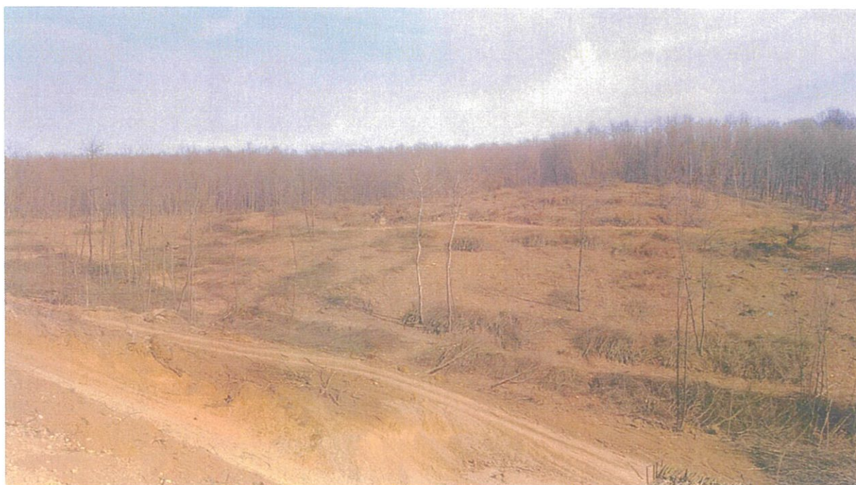
Územie budúcej 3. etapy