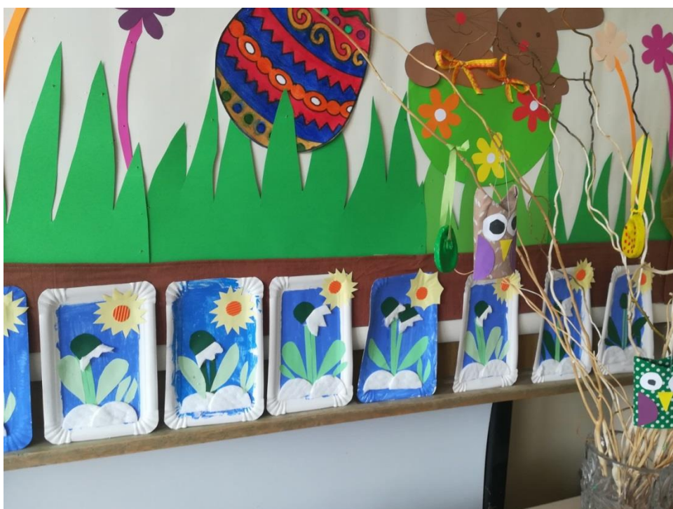
Veľká noc a príchod Jari