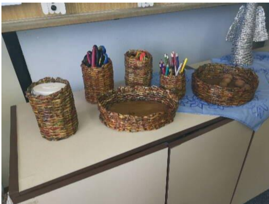
Ergoterapia – výroba košíčkov