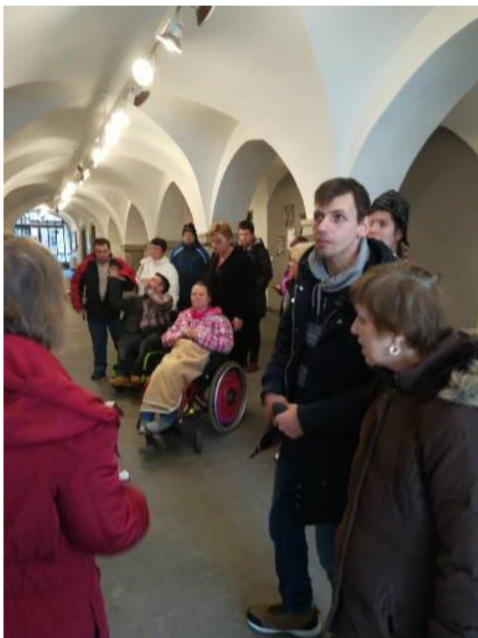
Návšteva Galérie Umelcov Spiša