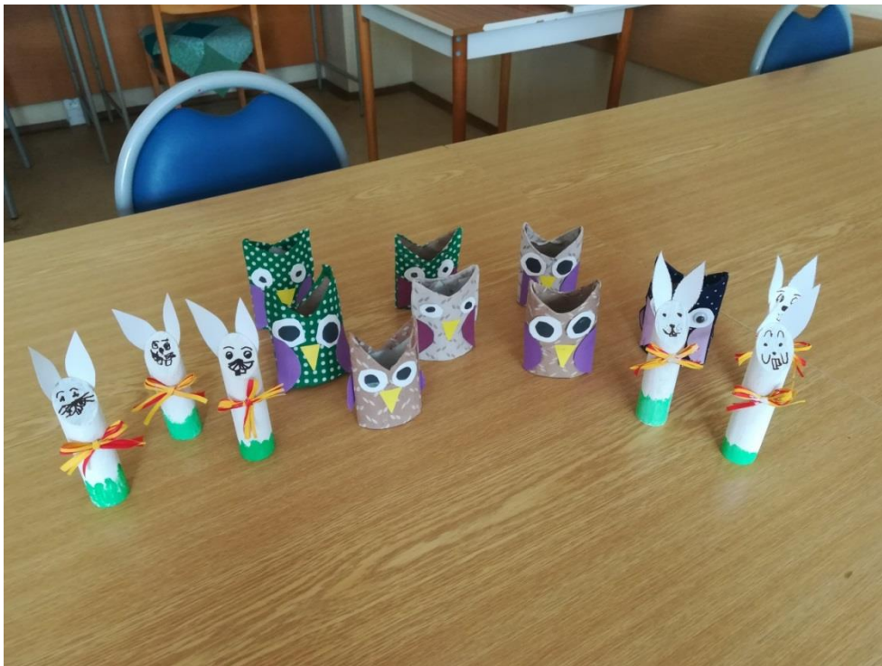
Ergoterapia – práca s papierom, nožnicami a lepidlom