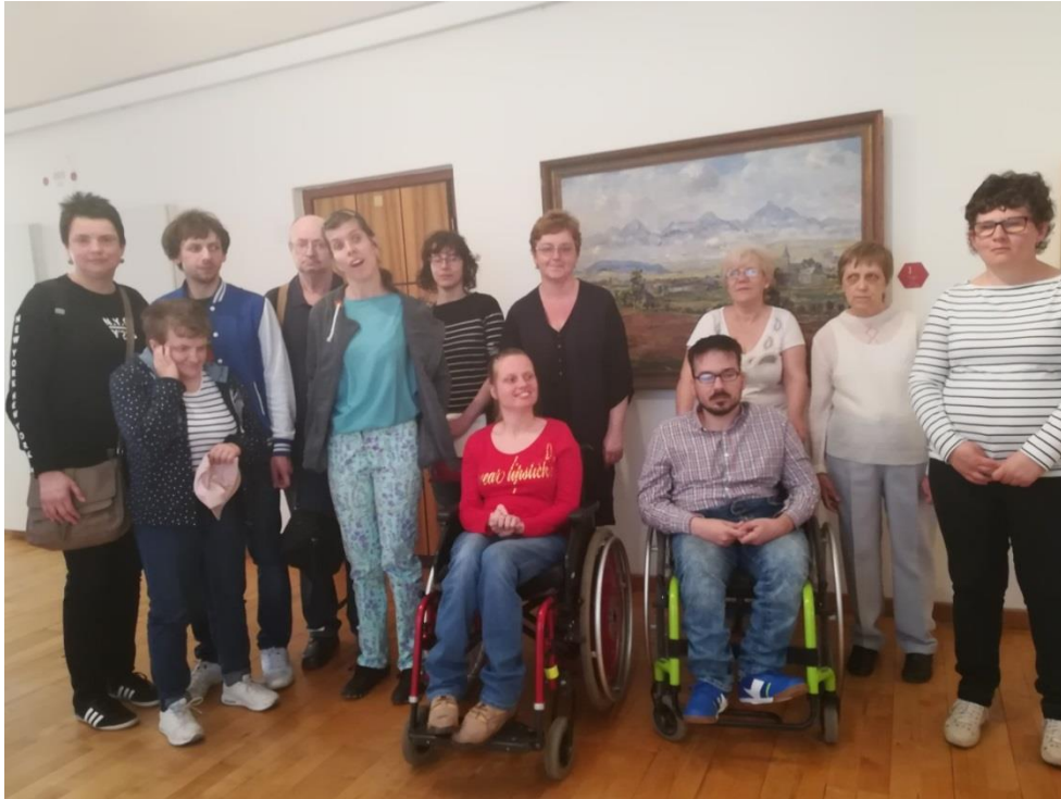
Návšteva Kaštieľa Smižany