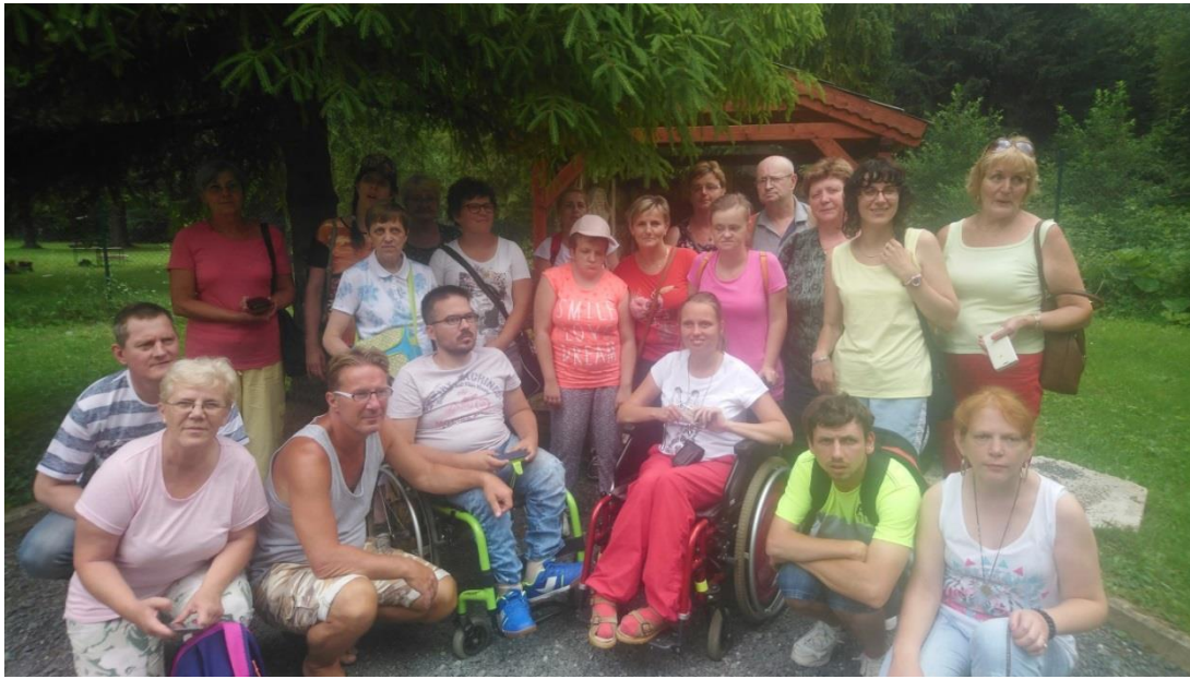
Výlet 2018 – Liptovský Ján