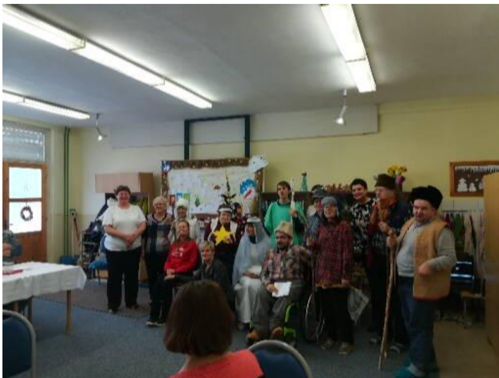
Vianočná besiedka 2018