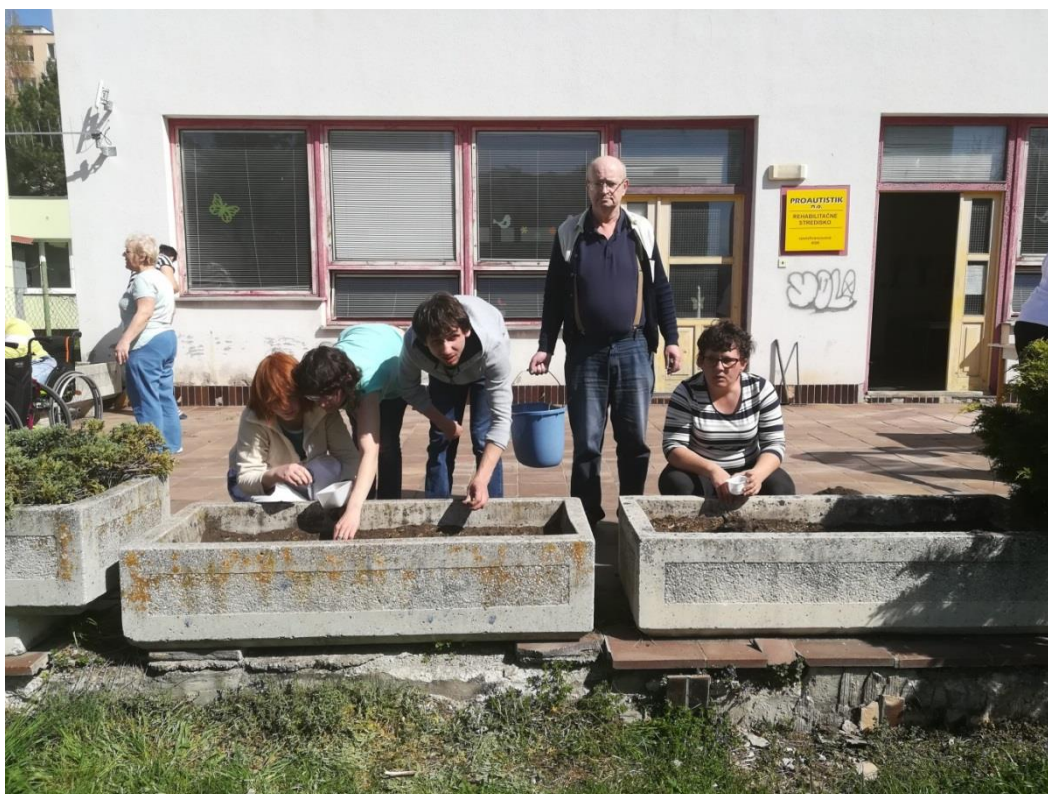
Deň Zeme 2018