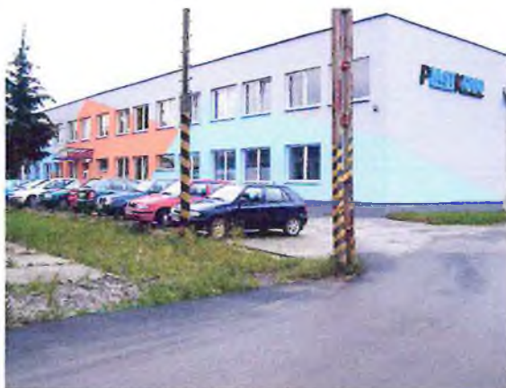
Výrobná hala KOVOLISOVNĀ