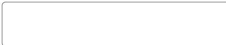
Podpis Signature / Unterschrift