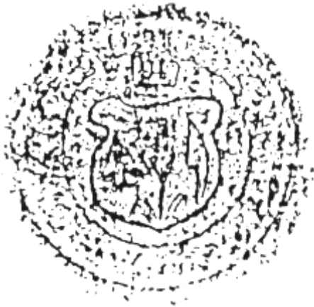
Pečat' Machuliniec z 18. stor.

Z úcty k vlastnej histórii obce je najvýhodnejšie pečatný symbol využiť aj pre tvorbu nového erbu obce. Je však ho potrebné vhodne hierarchicky štylizovať a farebne zladiť. Symbol lemeša, čeriesla a klasu treba považovať za významovo hlboký. Nemožno sa uspokojiť len s konštatovaním, že ide o poľnohospodársky motív.