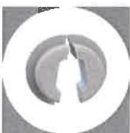
Štandardné a odľahčovacie priechodky, krycie zátky