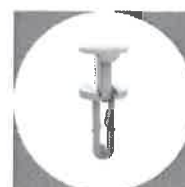
Níty, klipsy a zatlačovacie prvky