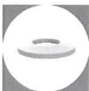
Podložky, rozpery a púzdra