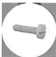
Škrutky a matice