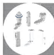
Zámky, západky, pánty a závesy