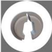
Štandardné a odľahčovacie Podložky, rozpery a púzdra priechodky, krycie zátky