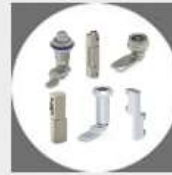
Zámky, západky, pánty a závesy