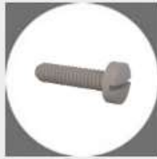
Skrutky a matice