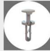
Nity, klipsy a zatlačovacie prvky