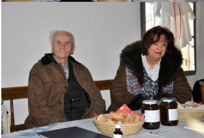
Fotogaléria z uvedenia knihy povestí do života