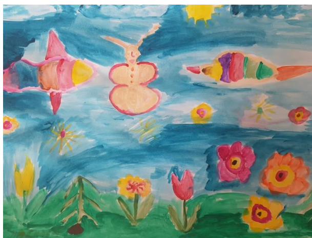
Autorka maľby: Beátka M.

Správna rada prerokovala a jednohlasne schválila predloženú výročnú správu za rok 2018 dňa 24.6.2019