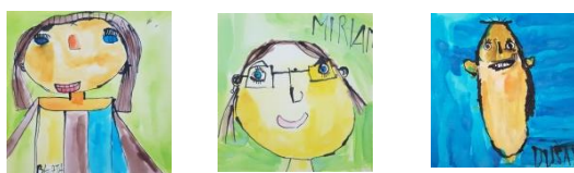
Autori malieb: prijímatelia sociálnej služby RS CLAUDIANUM