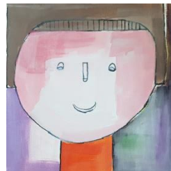
Autori kresieb: prijímatelia sociálnej služby rehabilitačného strediska CLAUDIANUM