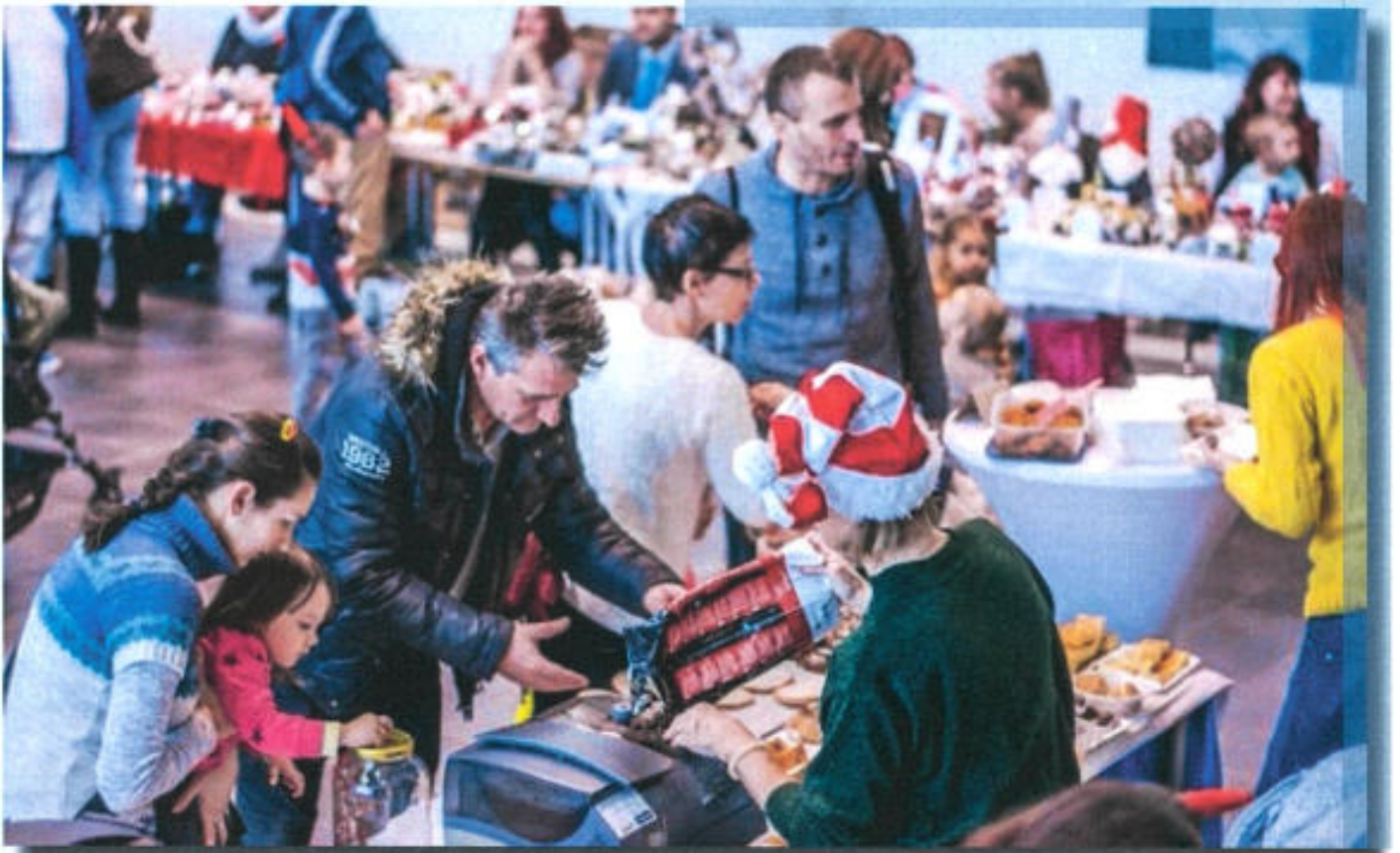
Vianočné trhy a Mikuláš 2018