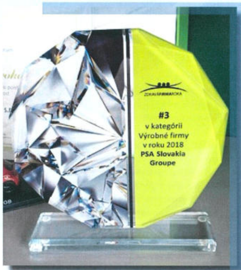
Zdravá firma roka