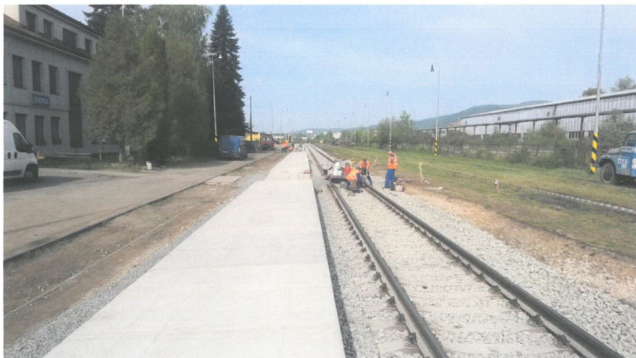
Komplexná rekonštrukcia železničného zvršku koľ.č.1 v žst. Snina a žst. Stakčín

Objednávateľ: Železnice Slovenskej republiky, Bratislava