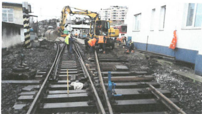
Opravy a rekonštrukcie koľaji Objednávateľ: Železničná spoločnosť Slovensko