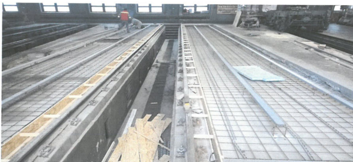
Opravy a rekonštrukcie koľaji Objednávateľ: Železničná spoločnosť Cargo