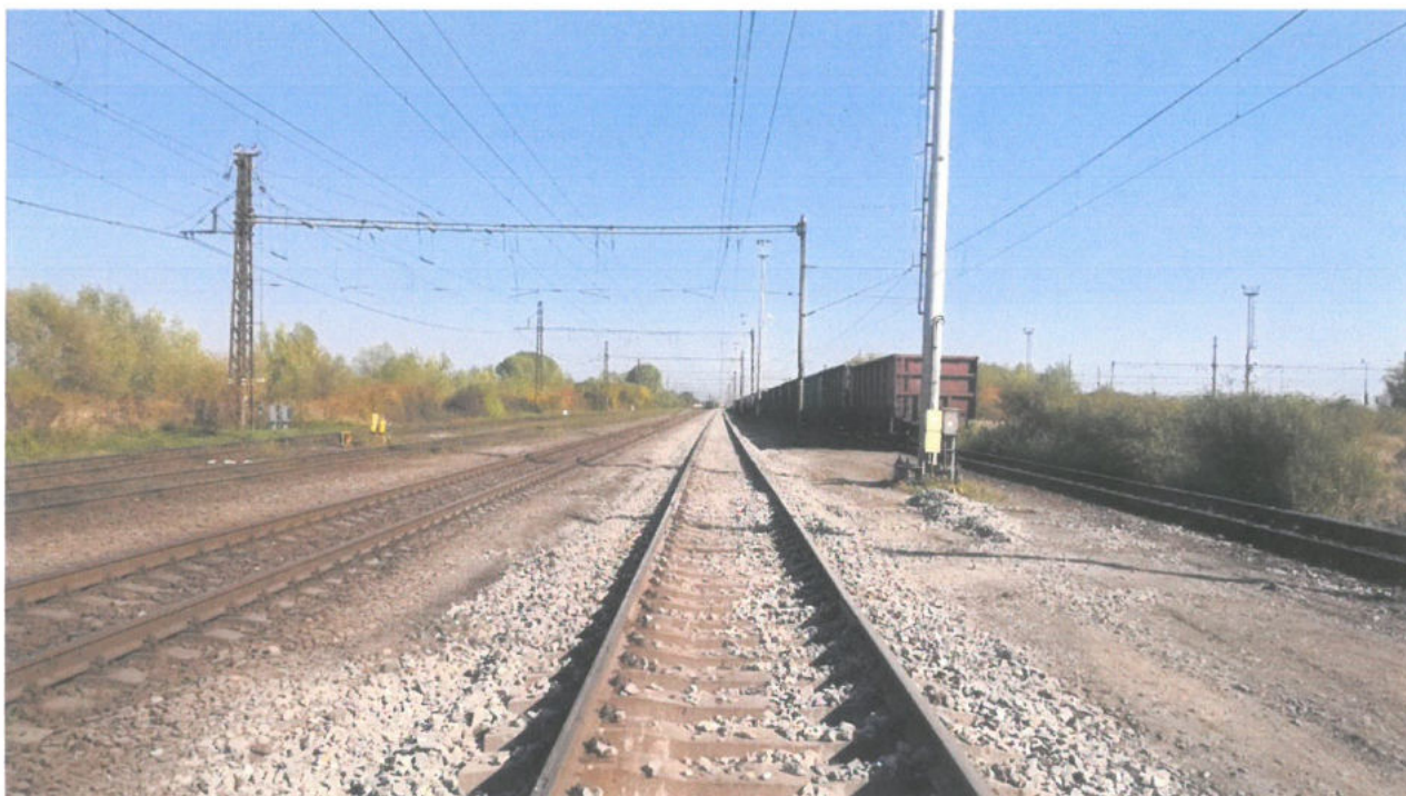
Koľaj 3š v žst. Maťovce

Objednávateľ: Železnice Slovenskej republiky, Bratislava