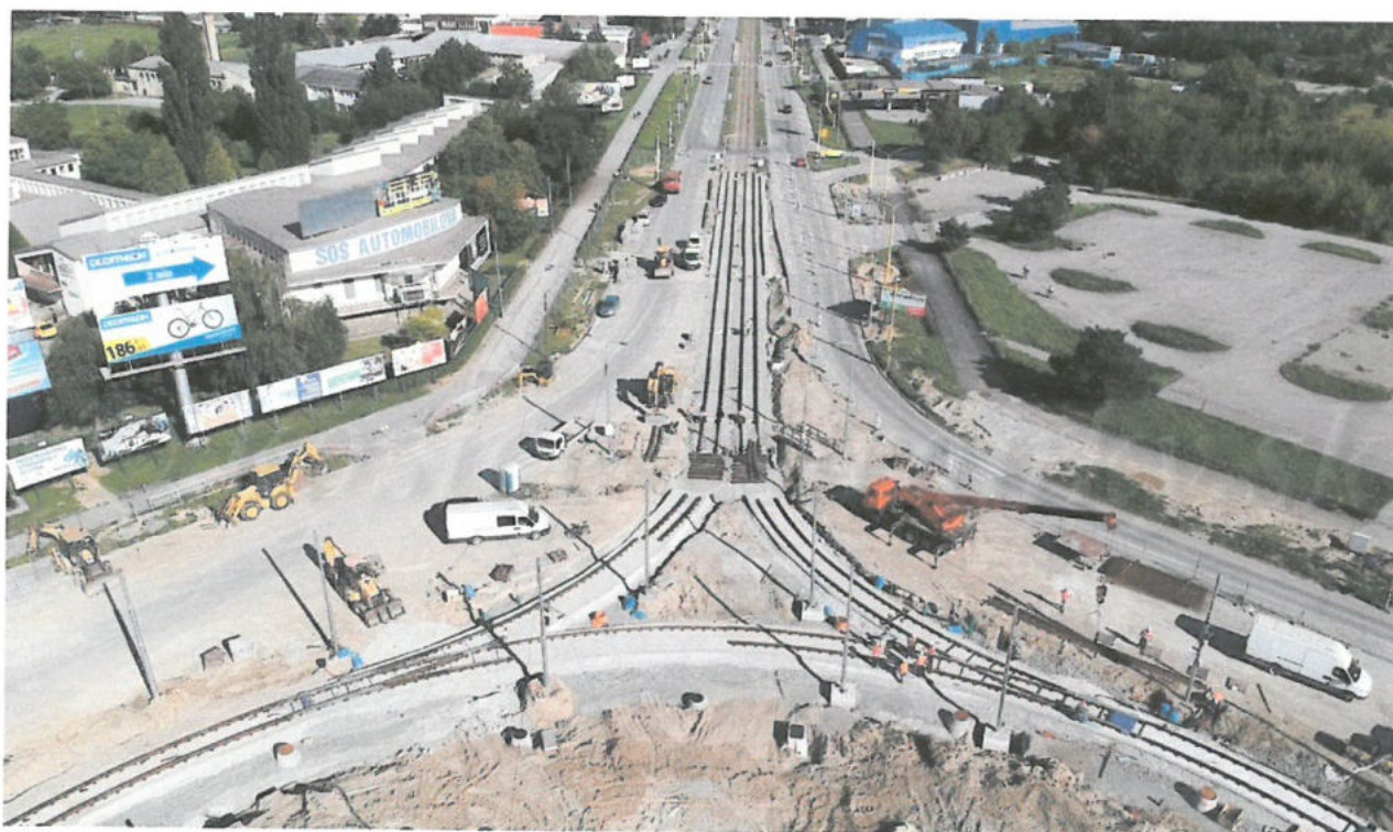
Modernizácia električkových tratí Košice Objednávateľ: EUROVIA SK a.s.