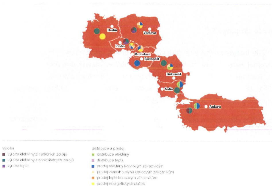
Obr: Působnost Skupiny ČEZ podľa teritória