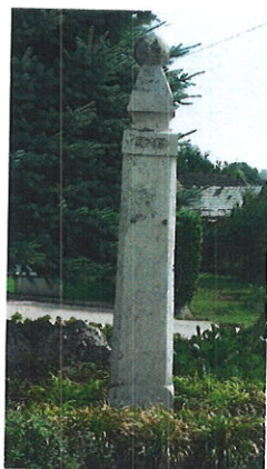
Pranier – stĺp hanby