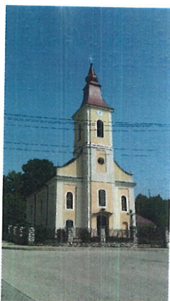
Kostol narodenia Panny Márie