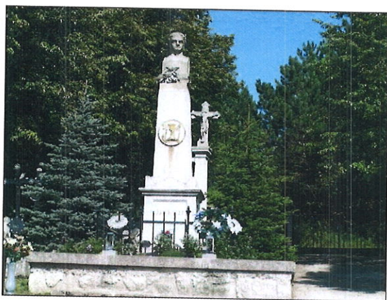
Pomník Jána Hollého