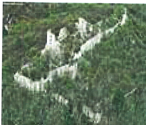
Dobrovodský hrad – zručenina