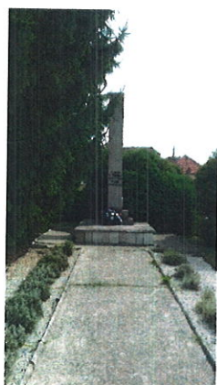
Pomník padlým v II. svetovej vojne