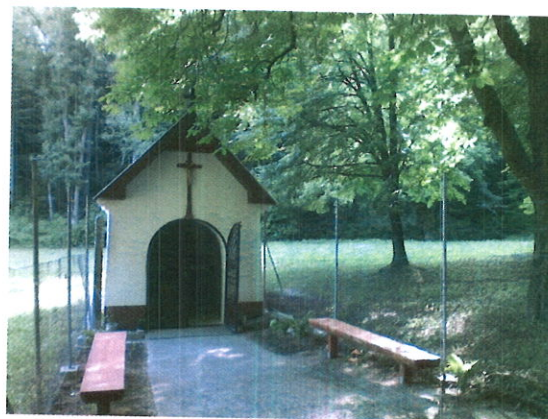
Kaplnka Najsvätejšej Trojice pod Mariášom