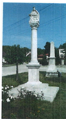
Pomník Sedembolestnej Panny Márie Šaštínskej