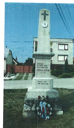
Pomník padlým v I. svetovej vojne