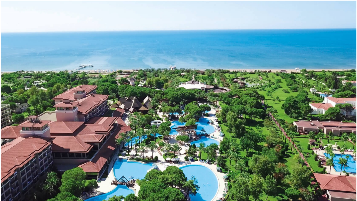
Ic Green Palace, Turecko

Majoritným poskytovateľom charterovej leteckej dopravy bola spoločnosť Travel Service Praha. Voľnú časť kapacít poskytovala CK partnerským spoločnostiam TATRATOUR, KoalaTours, Seneca Tours a viacerým subchartererom. Lety do Spojených Arabských Emirátov a Egypta boli zabezpečené cez spoločnosť Blue Sky Travel – Fly Dubai, Air Cairo.