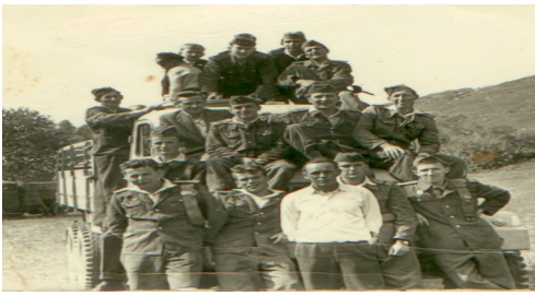
Dobrovoľný hasičský zbor z roku 1959