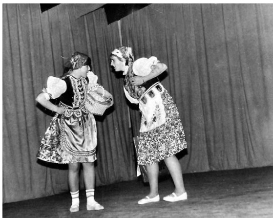
Táto fotografia pochádza zo sedemdesiatych rokov 20. storočia a zachytáva krátku divadelnú scénu, ktorú dievčatá odohrali v krojoch, tzv. napodobeninách niekdajších krojov, ktorými sa vyznačovala obec.

Výrazný odliv obyvateľstva v druhej vlne nastal hneď po vzniku I. ČSR. Dôsledkami I. svetovej vojny obyvateľstvo trpelo nedostatkom jedla, ktoré bolo na pridelové lístky. Zásobovanie tovarom viazlo, ale postupne sa aspoň uvoľnila situácia, ktorá umožňovala vycestovať a získať prácu za morom. Tretia veľká migračná vlna postihla obec v krízových 30 rokoch 20. storočia. Kocel'ovce nikdy nebola veľká dedina. V roku 1930 tu žilo len 223 obyvateľov, z čoho v krátkom čase odišlo do Ameriky 12 rodín a mnohé tam ostali natrvalo. Práve z návštevy po dlhých rokoch z USA na Slovensko pochádza táto fotografia. Tí čo zostali v obci, si vytvárali rôzne podporné a svojpomocné združenia a spolky.