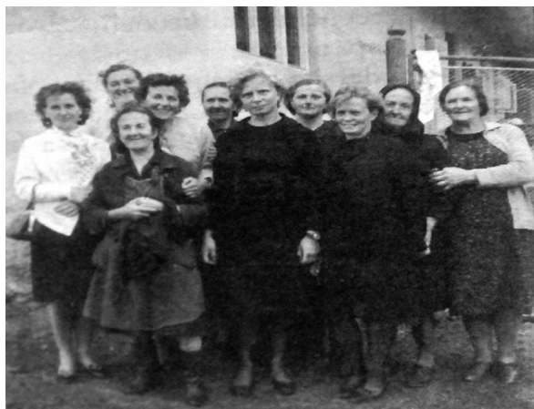
Táto fotografia vznikla pravdepodobne v 50 rokoch 20. storočia a vidíme na nej návštevu amerických migrantov v rodnej obci Kocel'ovce.