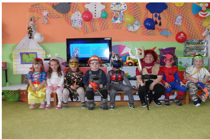
Maškarný ples v šk. roku 2015/2016