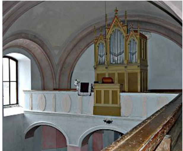
Organ z roku 1908