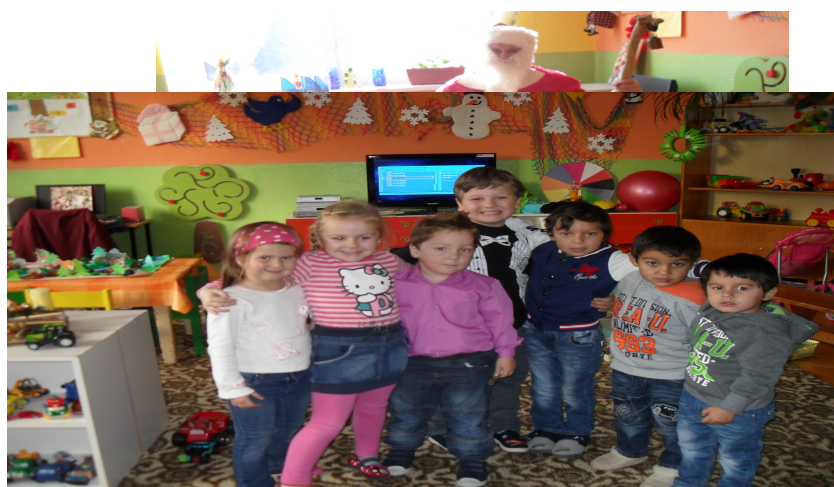
Mikuláš v Materskej škole v šk. roku 2015/2016