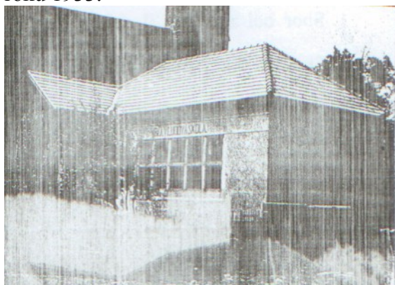
Budova starej školy z roku 1933