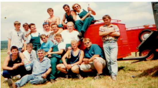
Dobrovoľný hasičský zbor z roku 2002