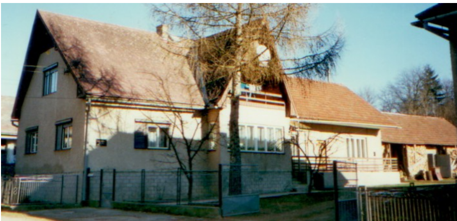
Budova novej fary