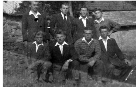
Táto fotografia vznikla okolo roku 1960 vidíme na nej osem členov Dobrovoľného hasičského zboru Kocel'ovce