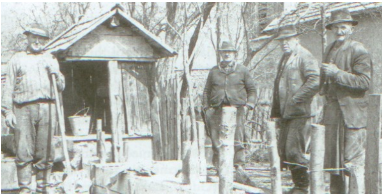
Muži z Kocel'oviec v pracovnom oblečení