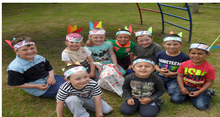
Deň detí v Materskej škole šk. rok 2014/2015