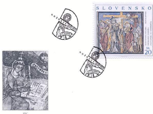
Známka obce: Nástenná maľba Kocel'ovce, Snímanie z križa