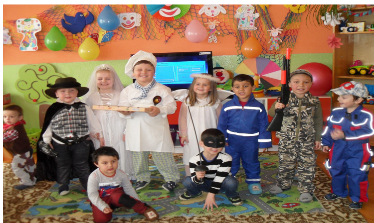
Maškarný ples v šk. roku 2014/2015