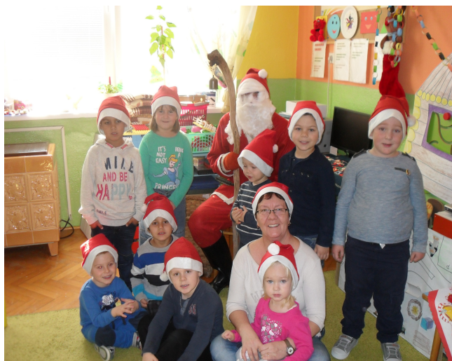
Mikuláš v Materskej škole v šk. roku 2016/2017