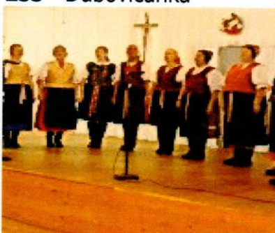
ŽSS - Dubovičanka