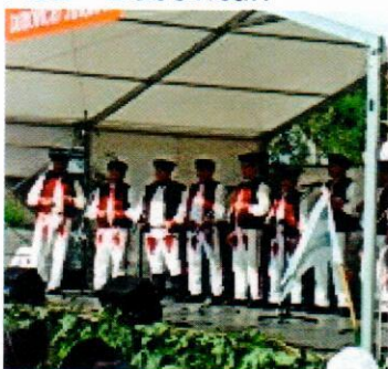
MSS - Dubovičan