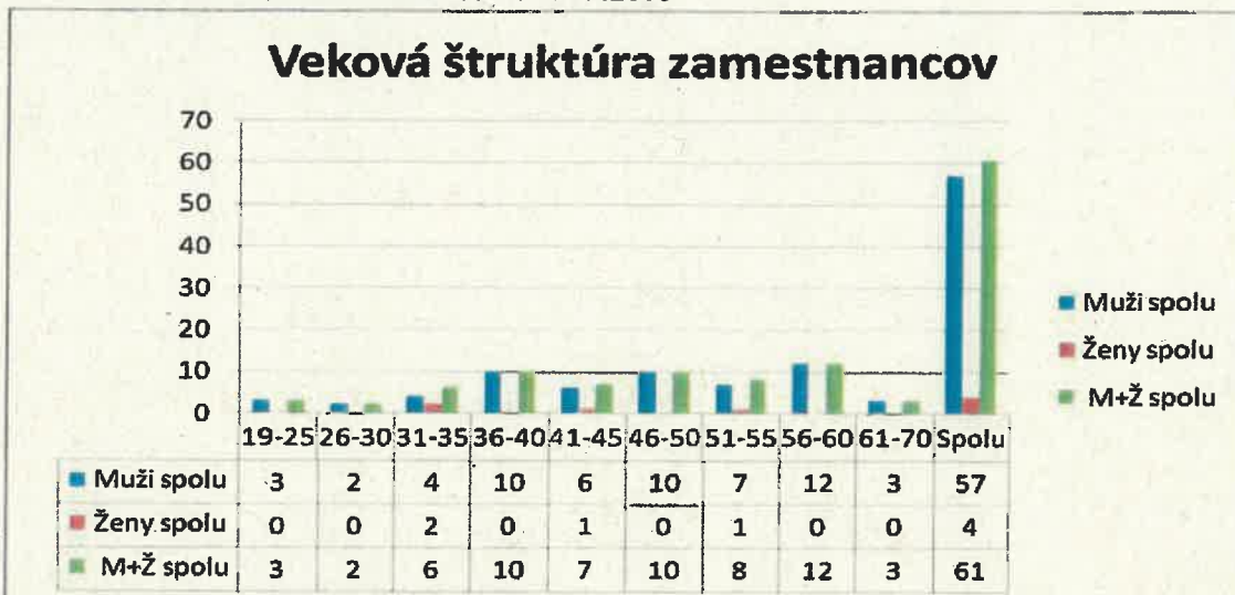
Graf 1: Veková štruktúra zamestnancov k 31.12.2018

Zdroj: Spoločnosť BHG Logistika spol. s r.o.