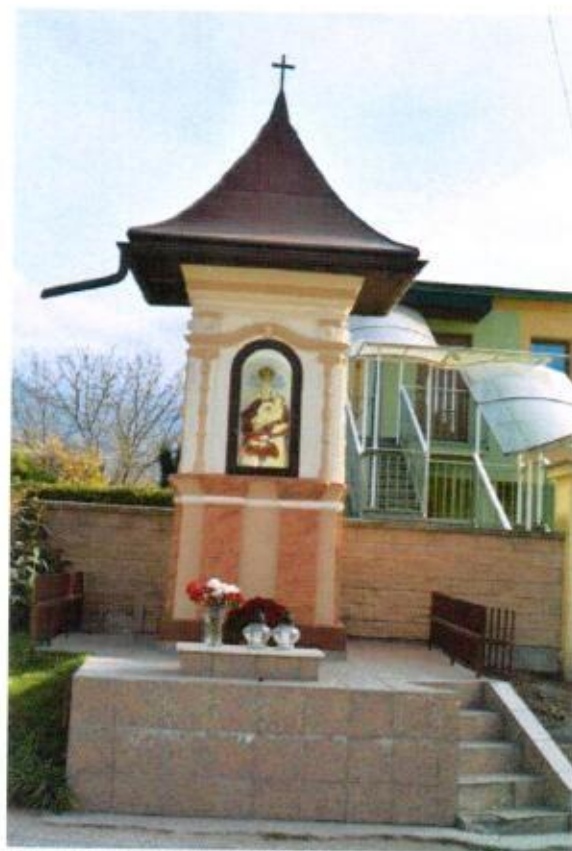
Obnovená kaplnka v roku 2018

V obci je tiež renesančný kaštieľ s menším kostolíkom, ktorý bol od druhej polovice 16. storočia sídlom staro-hradského panstva. Okolie dotvára park. Kaštieľ je toho času v súkromnom vlastníctve. Vlastníkom je spoločnosť G.R.L. s.r.o. Žilina.