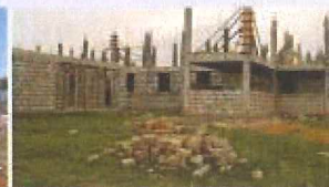
Výstavba miestnosti pre knižnicu a učiacu výstavbu 1. poschodia