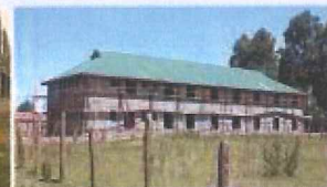
Marec 2011 - Aktuálna fáza internátu SALVE STUDENT HOUSE

SALVE znamená po latinsky "Vitaj!". Vitáme každého, kto chce svojimi 2 % chce pomôcť naplniť spolu s nami poslanie, ktorým je vzdelanejšia a zdravšia spoločnosť.