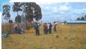
Január 2009 - Pozemok Salve Student House výkop vody

SALVE STUDENT HOUSE V KENI - internát pre 56 dievčat, s knižnicou a počítačovou miestnosťou.