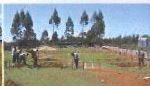
Výkop základov stavby